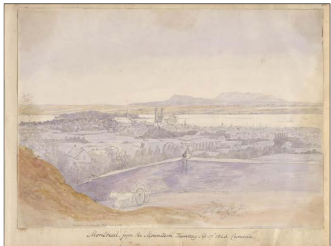
Montréal, from the Mont Royal, 1846, by Seymour.

Ill. : Sir Michael Seymour, mine de plomb et aquarelle sur papier, 11 septembre 1846, MNBAQ, 2010.229