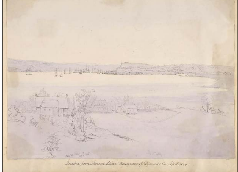
Québec, from Mount Lilac, Beauport, 1846, by Seymour.

C'est à Montréal que la frégate jette l'ancre le 15 septembre. Le lendemain, alors qu'il se trouve sur l'île Sainte-Hélène, Seymour dresse le profil de Montréal, devenue en 1844 la deuxième capitale du Canada-Uni. Le 17, notre homme fait l'ascension du mont Royal d'où l'on a une vue imprenable sur la ville. Il résulte de cette excursion une vue panoramique de la cité en pleine expansion d'où pointent plusieurs clochers – dont ceux de l'église Notre-Dame –, et derrière la-