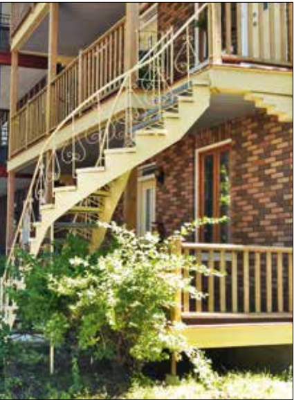
Des quartiers anciens comme Limoilou, à Québec, sont déjà denses, même si le gabarit de leurs bâtiments n'est pas particulièrement imposant.

bâti, certaines transformations affectent les permanences structurales. C'est le cas lorsqu'on modifie la trame viaire, ou lors du démembrement de grandes propriétés, du remembrement foncier ou d'un changement radical d'échelle.