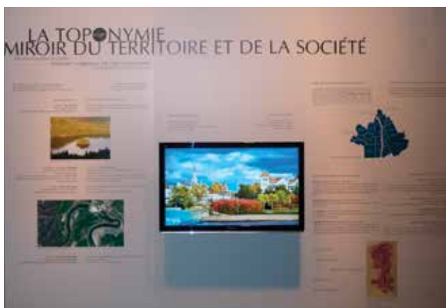
L'exposition itinérante Le nom de lieu, signature du temps et de l'espace a d'abord été présentée au Musée de la civilisation en 2012. Elle s'arrêtera au Musée amérindien de Mashteuiatsh après les Fêtes.