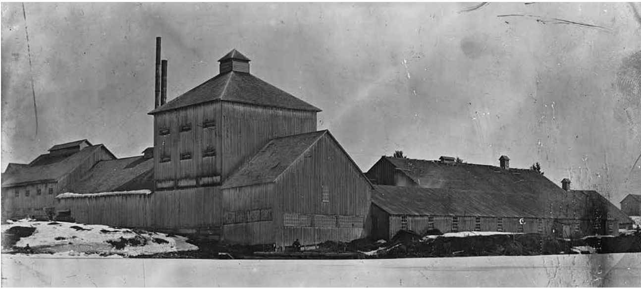
À Drummondville, la rue de la Tannerie rappelle par son nom la présence à proximité de la tannerie Shaw & Cassils au XIX e siècle.