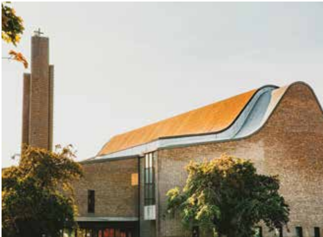
Dans le cas de l'église Saint-Gérard-Majella, la diffusion d'information sur la valeur patrimoniale du bâtiment a suscité une mobilisation citoyenne et permis d'éviter la démolition.