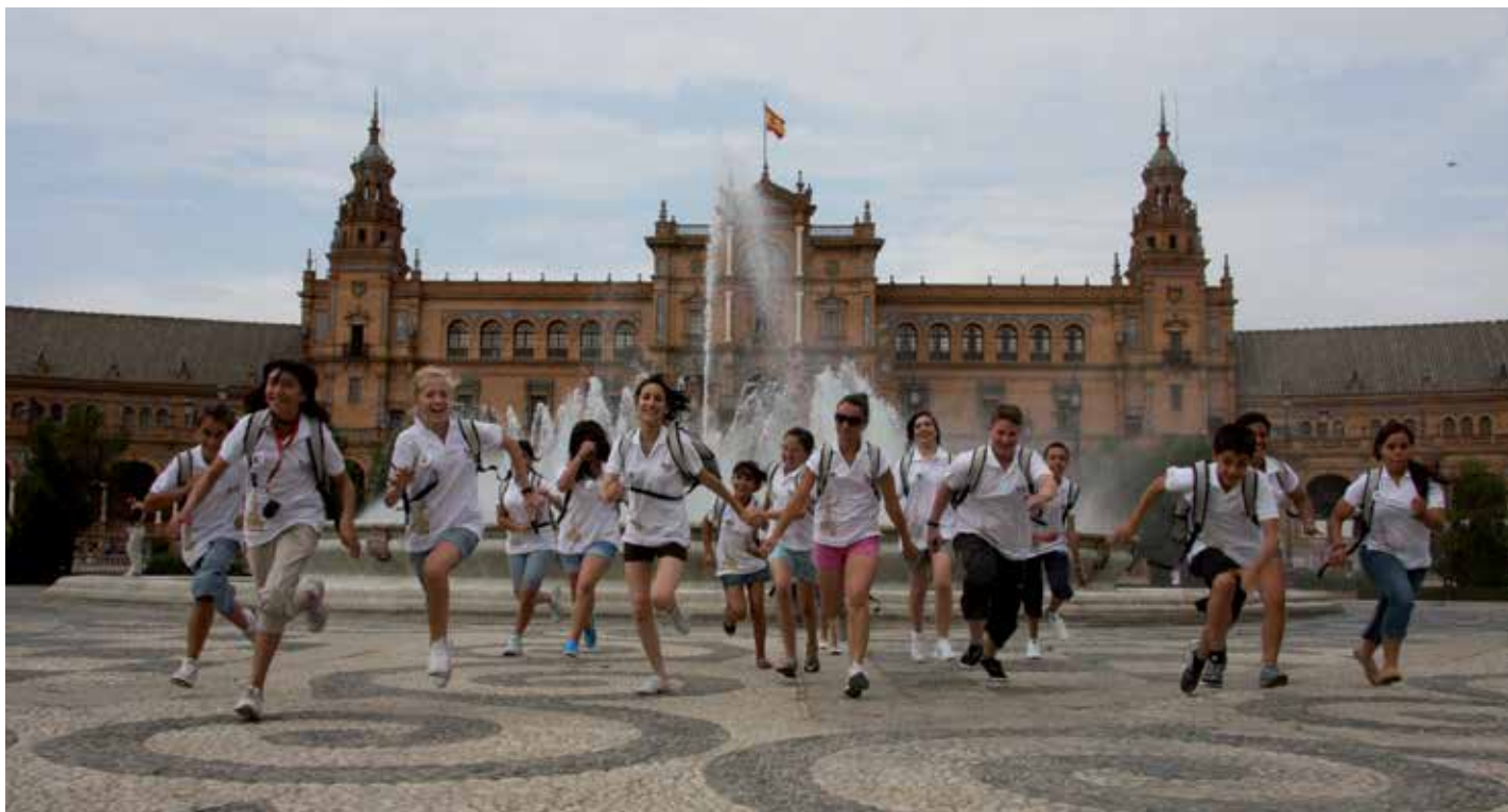
Des jeunes issus de huit pays ont pris part au Forum en 2009. Ils ont notamment visité la place d'Espagne, à Séville.

Il s'agissait de produire du matériel didactique destiné à des jeunes et fait par eux, dans un langage et selon une interprétation patrimoniale qui leur sont propres.