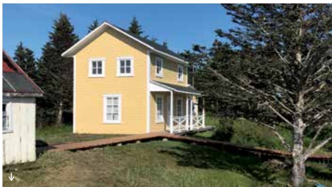
Maison natale de Gilles Vigneault