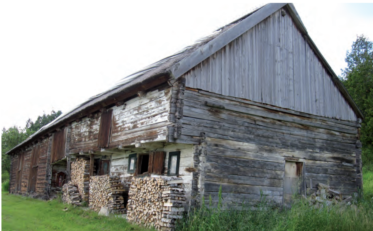
Grange-étable Bhérier de Cap-à-l'Aigle, à La Malbaie. Cette construction à encorbellement, de tradition allemande, a été bâtie en bois pièce sur pièce et dotée d'une toiture en chaume.

Chaque structure compte ses caractéristiques propres qui tiennent à une diversité de facteurs : topographie, disponibilité des matériaux, techniques de construction en usage, pratiques agricoles, etc.