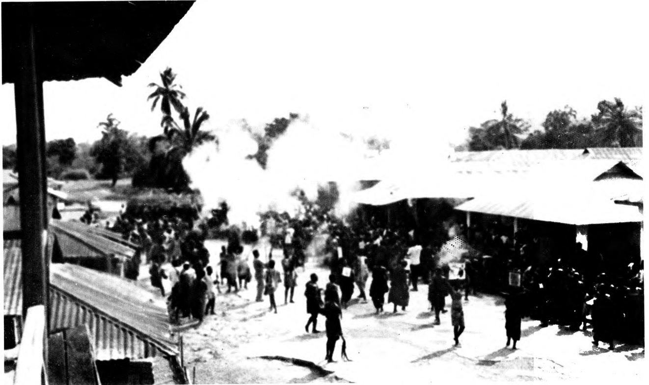
Funérailles et salves de fusil.

Somme toute, l'évolution du système de tenure foncière sous-tend un appauvrissement graduel de la population immigrée sans terre : le système abunu de location des terres avec remise au propriétaire akan de la moitié de la récolte de produits vivriers a maintenant supplanté le système dibi de développement des plantations de cacao.