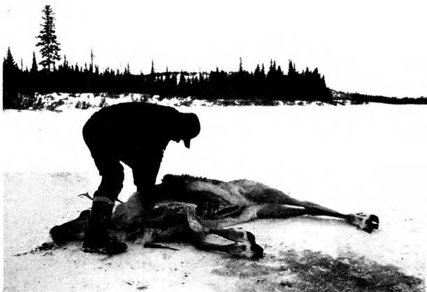
Chasse au caribou.*

temps au cours desquelles un modèle relativement homogène d'occupation territoriale avait prévalu. Comme le nombre potentiel d'informateurs et informatrices pouvant témoigner de leurs pratiques territoriales personnelles s'élevait à plus de 4,000, on décida d'orienter la recherche en fonction de la collecte d'années-témoins des activités sur le territoire pour chacune des périodes jugées significatives, plutôt qu'en fonction de l'approche biographique visant à identifier toutes les parties du territoire utilisées par un informateur au cours de sa vie active. Ainsi les personnes les plus âgées devaient être appelées à fournir des témoignages sur chacune des périodes de l'ère contemporaine d'occupation territoriale, alors que les plus jeunes ne devaient témoigner que pour la période la plus récente. Ainsi, l'addition des témoignages des informateurs pour une même période devait fournir une vision complète du mode d'occupation et d'utilisation territoriale pour cette période. En contrepartie, ce choix méthodologique permet de rejoindre le maximum d'informateurs et de mettre de côté l'idée d'un échantillonnage au prorata de la population de chaque communauté.