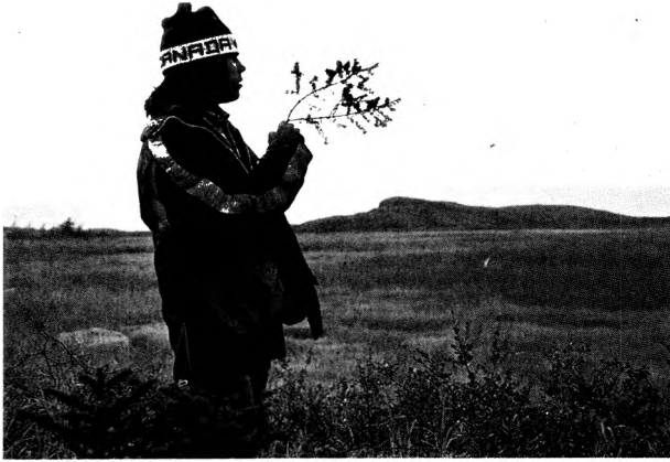
Le domaine montagnais.*

tation des conseils de bande concernés. Ceci permet au CAM et aux communautés de s'assurer que le projet respectera leurs besoins et leurs intérêts fondamentaux. L'utilisation des fonds de recherche ainsi que des données se trouve donc soumis à l'approbation majoritaire des représentants montagnais.