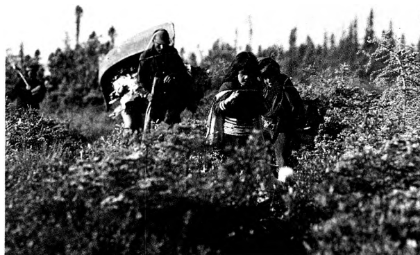
Une expédition de pêche. 2

Les grandes lignes de ce programme de recherche comprennent des études sur l'occupation du territoire, sur l'utilisation des ressources renouvelables et non-renouvelables, sur les impacts des développements (forestiers, miniers, hydro-électriques, cynégétiques et halieutiques) passés et prévus