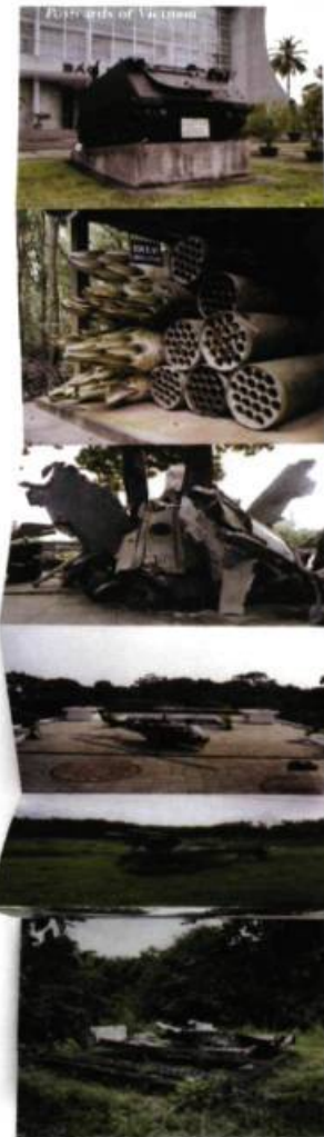
Cartes postales du Vietnam

dépliant Carcasses militaires tirage couleur 13 x 120 cm 2004