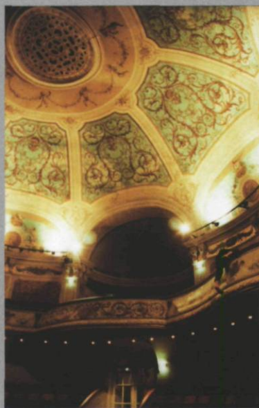
On ne sait jamais où tombent les bombes 1 et 3 (Théâtre d'Arras), 2007, 150 x 90 cm

L'exposition Les dialogues acrobatiques proposait deux corpus d'images opposés tant par les stratégies narratives mises en place au sein des photographies que par le traitement du texte les accompagnant. On ne sait jamais où tombent les bombes (2007), première série de trois prises de vue effectuées à l'intérieur du fastueux Théâtre d'Arras, épargné miraculeusement par la Révolution française et les pilonnages des deux Guerres mondiales, présente un homme en fuite suspendu à la rambarde du balcon ou étendu entre les rangées de sièges. Filant au bas des murs, obligeant le spectateur à se plier pour les lire, quelques phrases écrites au « je » adressées à un « tu » anonyme laissent paraître vaguement les impressions qu'inspire le lieu