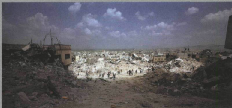
Luc Delahaye, Jenine Refugee Camp , 2002

issues. The self-explanatory Jenine Refugee Camp (2002) puts viewers in direct contact with the Israeli-Palestinian conflict and, as such, should constitute a direct access to history in the making. Yet the photograph itself constitutes a subjective layer. The grand panorama format and the dramatic lighting transform the scene into a disturbingly attractive stage set. Invariably, viewers will return home with a personal memory of Delahaye's subjective portrayal of a historical event.