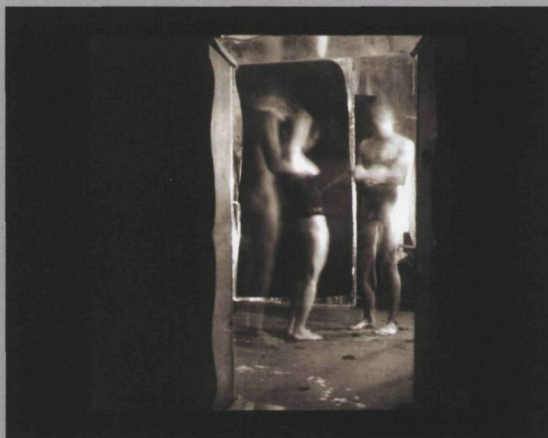
Kiev XVII, 2008, silver print on fibre paper, 40.5 x 51 cm.