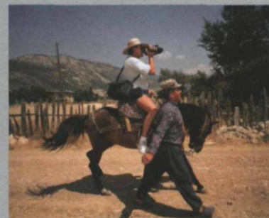
Martin Parr, Turkey. Kalkan, 1994