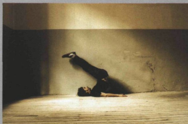
Se fueron los curas 4, 2007, 150 x 90 cm

— Anne-Marie St-Jean Aubre complète présentement une maîtrise en Études des arts à l'Université du Québec à Montréal. Elle s'intéresse tout particulièrement aux thèmes de l'identité et des enjeux culturels explorés par les pratiques artistiques contemporaines. —