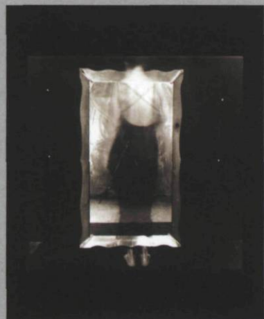
Kiev XVII, 2008, silver print on fibre paper, 40.5 x 51 cm

Although we can still see the etymological relationship between the modern term “technology” and the ancient Greek word techne , nowadays we generally lose sight of its original meaning – art, craft, skill. Éliane Excoffier's latest show at Galerie Simon Blais reminds us that aesthetics and technology go hand in hand. A student of art