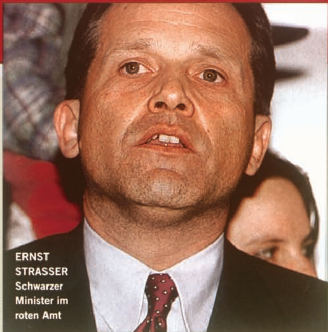
ERNST STRASSER Schwarzer Minister im roten Amt