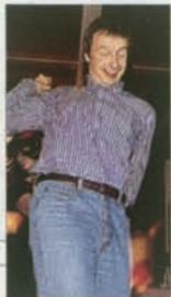
MARTIN BARTENSTEIN Rechtsverbinder zur FPÖ

– liebäugelte schon lange offen mit einer Zusammenarbeit mit der FPÖ und traf sich gern heimlich mit Jörg Haider. Als Wirtschaftsminister ist er nun mitverantwortlich dafür, dass in Österreichs Wirtschaft jenes Geld verdient wird, das laut Planung des früheren Familienministers Martin Bartenstein im Rahmen des „Karengelds für alle“ für die Familien ausgegeben werden soll.