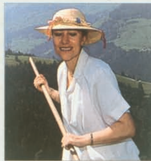
BENITA FERRERO-WALDNER Anwältin fürs Österreich-Image

B evor die 51-jährige Salzburgerin europäische Politiker wie Jörg Haider mit einem „aufgeregten Hühnerstall“ vergleichen würde, ginge sie lieber ungeschminkt und in Jeans ins Amt. Ferrero gilt als Großmeisterin der Etikette und des diplomatischen Protokolls: stets durchgestylt, mit einer Schleife im Haar und ordentlichem Schuhputz. Als neue Außenministerin muss Ferrero-Waldner nun weltweit als Generalanwältin der Republik den Ruf Österreichs im Ausland verteidigen. Sie begann mit der diplomatischen Ochsentour schon vergangenen Freitag: Die Sanktionen der EU-Länder bezeichnete Ferrero als „Überreaktion“, doch – ganz Diplomatin