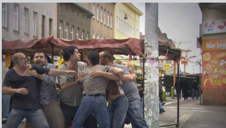
Mark Lewis, The Fight , 2008, single screen projection, 5 mn 27 s, HD video, film still courtesy Monte Clark Gallery (Vancouver)/Clark & Faria (Toronto)/galerie serge le borgne (Paris).

The constellation of temporary exhibitions, national representations, and thematic exhibitions that take over Venice for the first week of June every other year is usually a grand affair that defies any type of human scale. Surprisingly, that was largely untrue this year. Perhaps as a side effect of the slowing world economy, the majority of artworks and exhibitions seemed less glittery and over the top. This new-found seriousness at the Venice Biennale ultimately allowed a good number of interesting, intelligent, and compelling artworks to stand out without reverting to the shock-and-awe treatment of previous years. Within the realm of photography and video-based art, three artists' works are particularly worth a second look: those of Mark Lewis (Canada), Atta Kim (Korea), and Fiona Tan (Holland). Though each is quite different in content, all shared a simplistic and somewhat subdued approach that successfully embodied very powerful artistic voices.