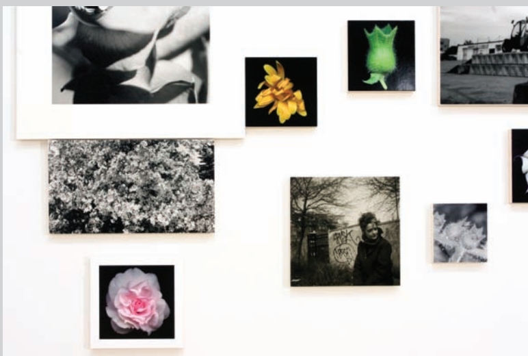
Yan Giguère, Attractions , 2009, vue d'exposition, crédit : Bettina Hoffmann.

de Gloire du Matin , etc. On retrouve cette fois aussi moins d'images relatives à l'intimité même de Yan Giguère. Sa compagne, par exemple, est moins présente. On ne la voit qu'en de rares occasions bien qu'une image nous la montre dans un cadre qui nous rappelle une image de Choisir . De même une constante se manifeste plus régulièrement dans le format des épreuves: la forme carrée, en effet, revient souvent. Sans oublier