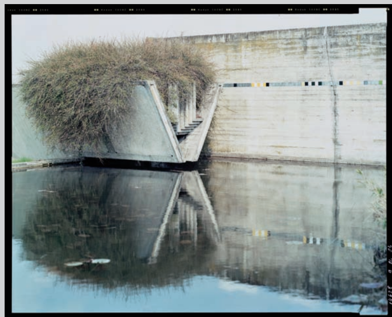
Guido Guidi, Brion's Family Tomba, San Vito d'Altivole : 13PM, looking to the North-East , 2003, c-print, 20,32 x 25,4 cm, courtesy of the CCA.

Guidi worked over a ten-year period to acquire an extensive series of views of the funerary complex. Collating appearances of the funerary complex at different times and in different seasons, he became a collector of fragments that add up to an un-