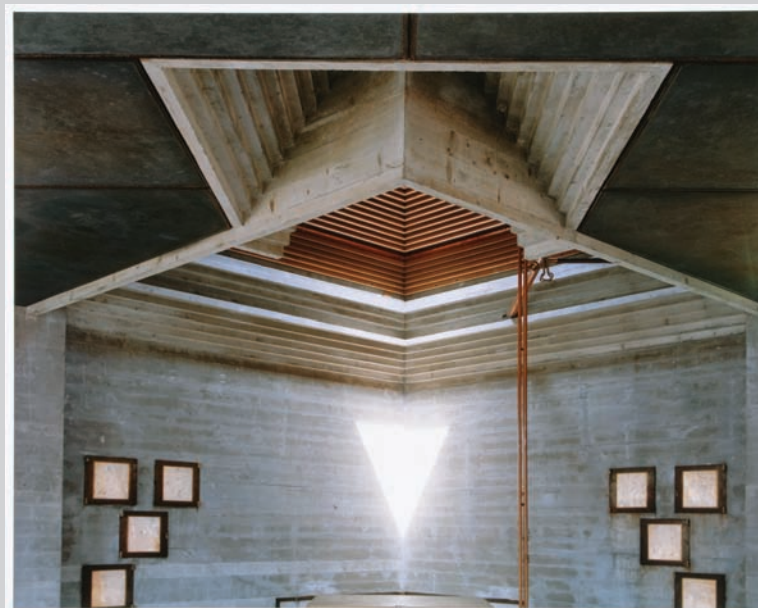
Guido Guidi, Brion's Family Tomba, San Vito d'Altivole: 12PM, Looking to the North , 2006, c-print, 60,8 x 76,4 cm, courtesy of the CCA.

James D. Campbell is a writer on art and independent curator based in Montreal. The author of over 100 books and catalogues on contemporary art and artists, he contributes frequently to visual arts publication across Canada.