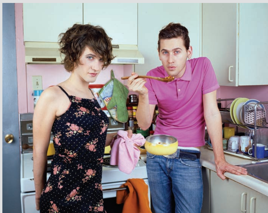
Untitled 1 & 3, 2007, de la série / from the series Alone Time , 2007-2009, impression jet d'encre / inkjet print, 43 x 56 cm