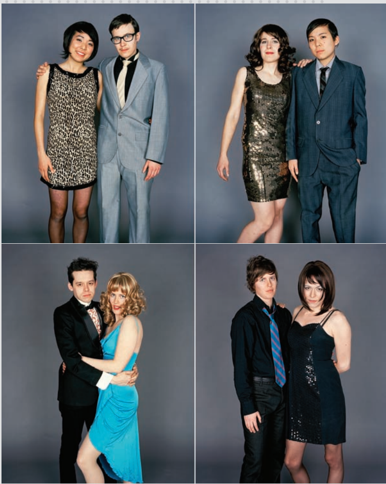
Untitled 6 & 5, 2009, de la série / from the series Switch , 2009, épreuve chromogénique / c-print, 152 x 102 cm