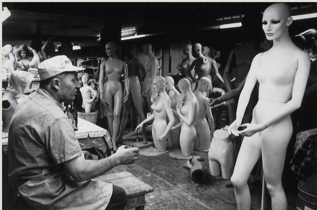
De la série / from the series Les Ouvriers , 1969–1972, épreuve argentique / gelatin silver prints, coll. MACM, permission de / courtesy of MACM PAGE 48 : Dominion Engineering, Montréal , 1970 (tirage / print 1980), 27,8 x 35,3 cm, photo : Denis Farley ; Ray Display, Montréal , 1970 (tirage / print 1980), 28 x 35,6 cm PAGE 49 : Eagle Toys, Montréal , 1971 (tirage / print 1980), 35,3 x 27,8 cm, photo : Denis Farley PAGE 50 : Mine d'or Sigma, Val-d'or , 1969 (tirage / print 1980), 35,3 x 27,8 cm, photo : Denis Farley