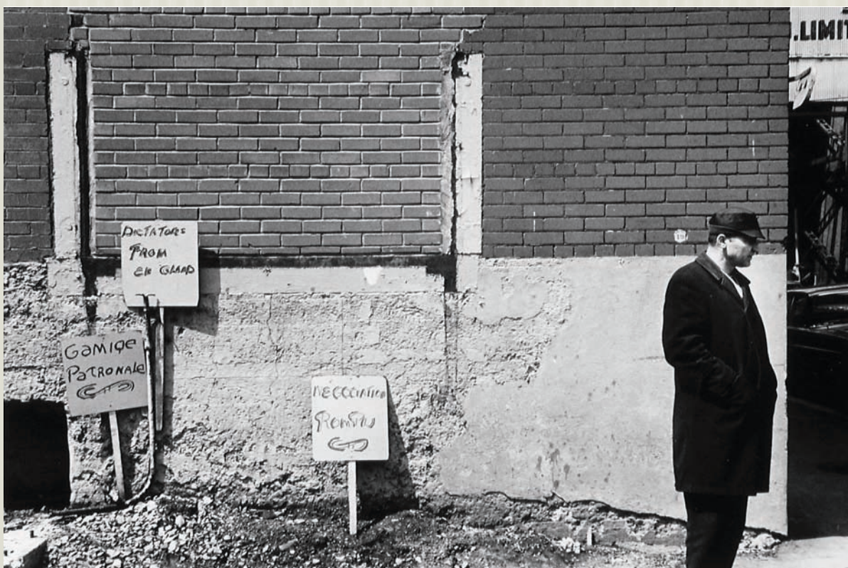
Grève chez Redpath, Pointe St-Charles, 1969 (tirage / print 1980), 28 x 35,6 cm

de dissonances visuelles où se lisent l'étrange cohabitation de deux mondes et l'envahissement de l'espace culturel par l'Amérique et ses symboles.