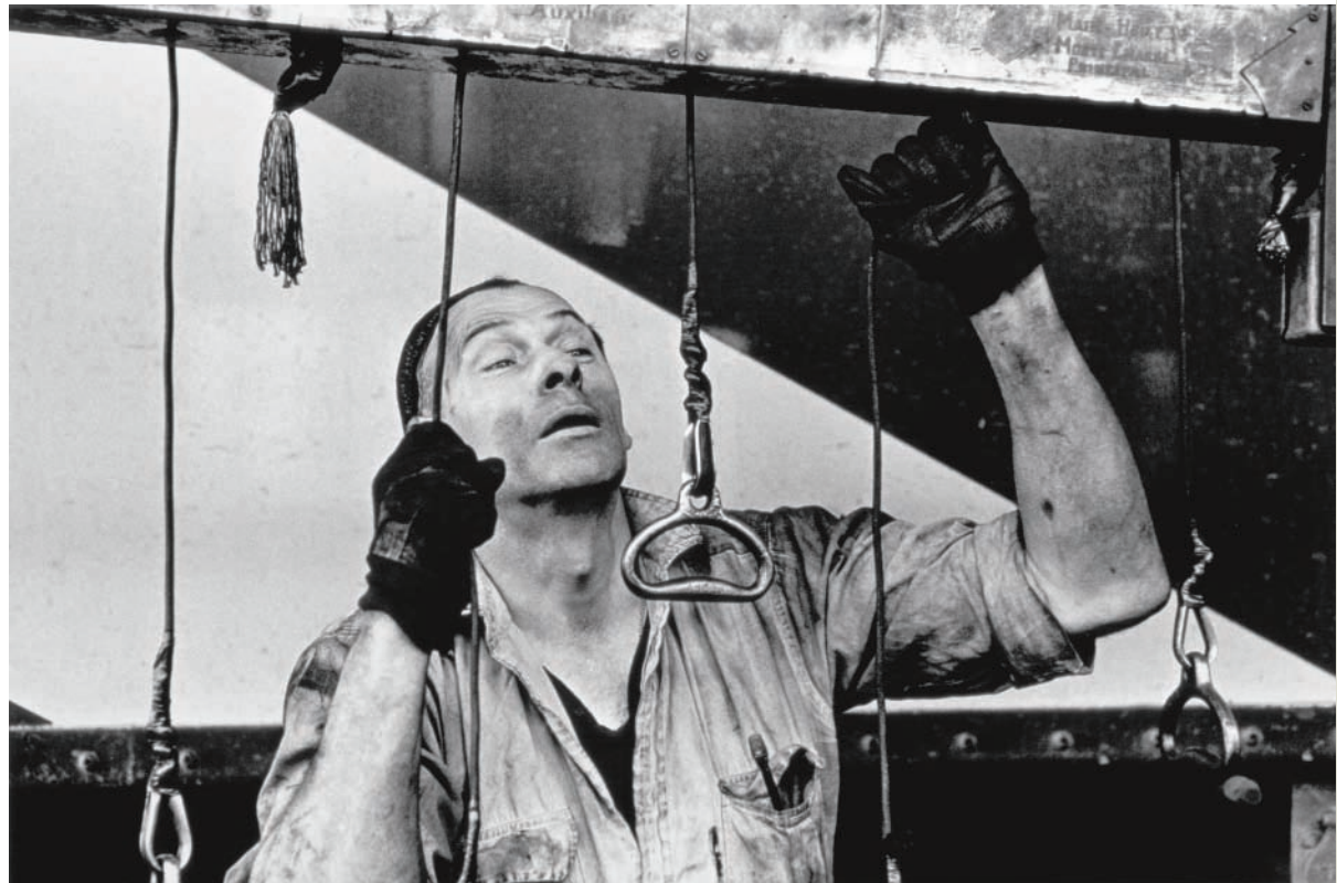
Usine C.N.R., Pointe Saint-Charles, 1969 (tirage / print 1980), 27,8 x 35,4 cm, photo : Denis Farley

Gaudard abandoned his reserve and neutrality to take a position; he threw himself to making images more freely, coloured with his personal, often ironic reactions, displaying a point of view nourished by the distance provided by thirty years of living in Quebec. The cultural codes that formed the social fabric had evolved in both