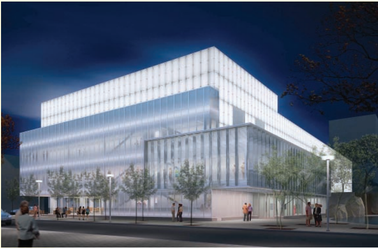
Simulation / Artist's rendering, School of Image Arts / Ryerson Gallery and Research Centre, permission de / courtesy of Cicada Design / Diamond + Schmitt Architects

sports centre; and the construction of a brand-new Student Learning Centre. The selection of world-renowned Diamond + Schmitt Architects to develop the new Image Arts Building and the Ryerson Gallery and Research Centre exemplifies Ryerson's commitment to putting itself on the map in significant ways, including architecturally.