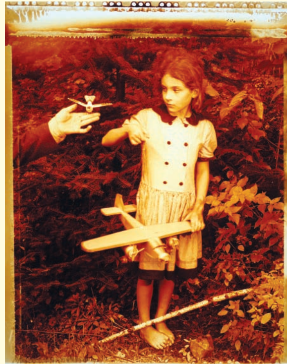
Volker Seding, Leopard, Usti, Czechoslovakia, 1992 , épreuve chromogénique / c-print, 23,4 x 30 cm, coll. Ryerson Gallery and Research Centre, image © Estate of Volker Seding, permission de / courtesy of Stephen Bulger Gallery