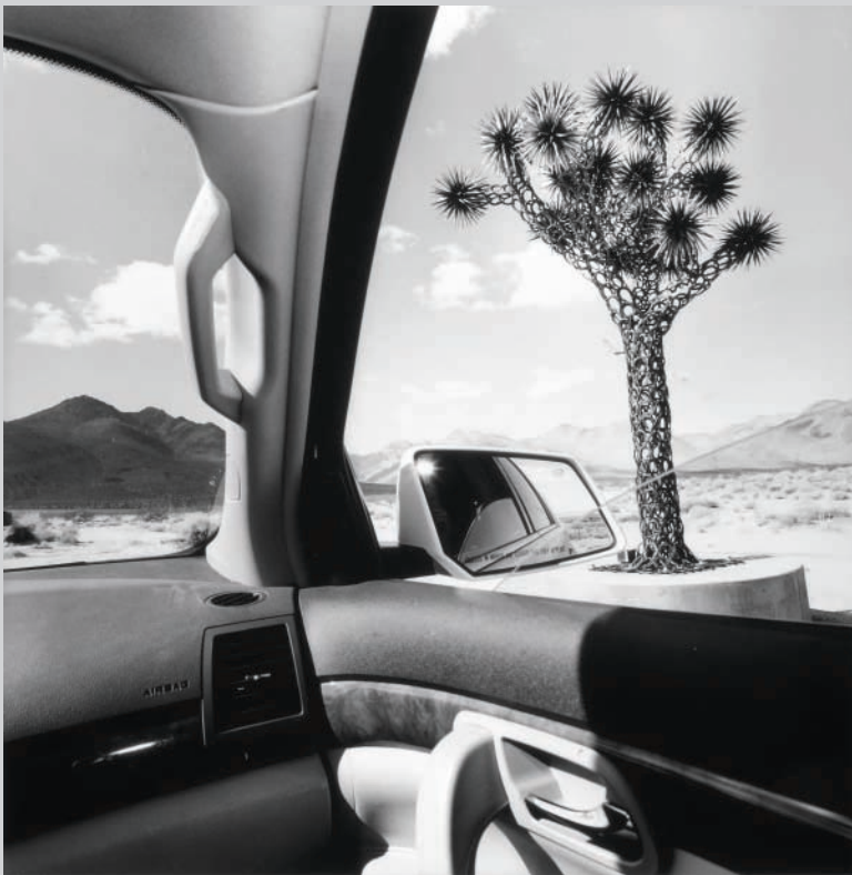
Lee Friedlander, California, 2008, from the series America by Car, 1995-2009, gelatin silver print, 38,1 x 38,1 cm, courtesy Fraenkel Gallery, San Francisco