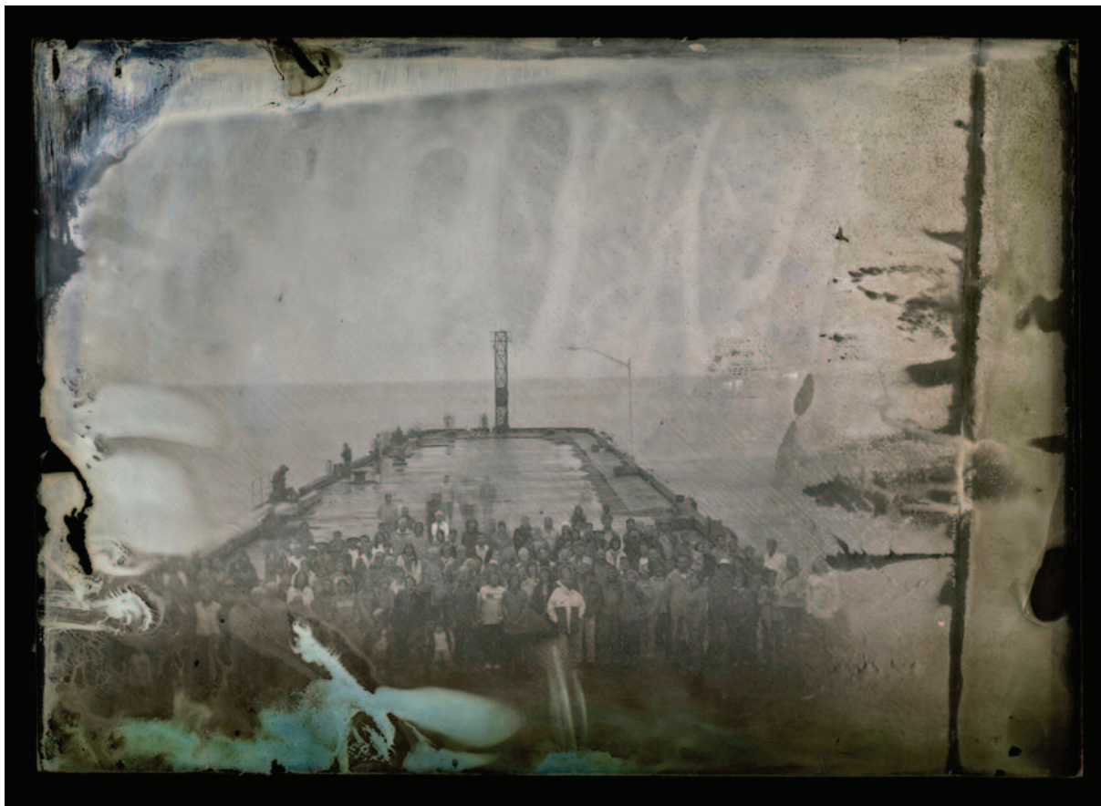
Maryse Goudreau, Chandler , 2012; New Richmond , 2011, projet Manifestation pour la mémoire des quais , images au collodion humide, négatif de verre PAGE 74 : Maryse Goudreau, photo : Estelle Marcoux