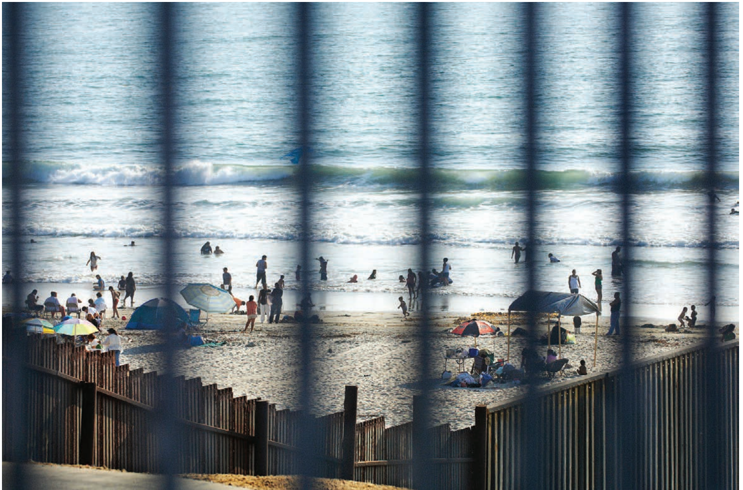
Guillaume D. Cyr, Maison No. 17, Cap-des-Rosiers , 2010, projet Gaspésie human less partie 1 Yana Ouellet, Maison No. 46, Nouvelle, Intérieur 1/5 , 2010, projet Gaspésie human less partie 1 Martin Beaulieu, Border Field State Park 02 , 2009, Californie