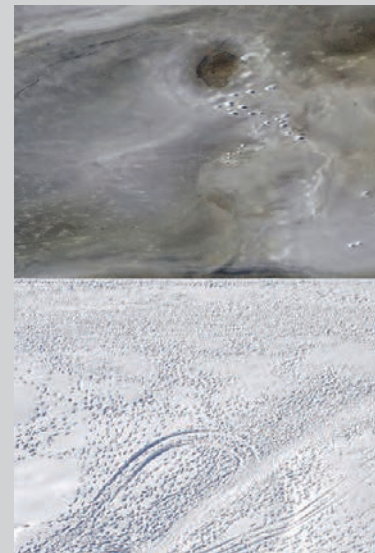
Verglas, 2012, impression à jet d'encre, 106 x 77 cm

Somme toute, l'exposition Bribes porte très bien son nom ; ce sont, en effet, des bouts de paysage qui y sont présentés, des « éclats » de lieux, rapiécés, créant un nouveau tout, plus près du ressenti que du montré. Et parmi cet ensemble d'œuvres dont la manipulation et la transformation du paysage par l'homme constituent le moteur, certaines images nous happent, d'autres nous questionnent. C'est dire que, malgré la rupture avec la tradition photographique, la sensibilité trouble que ces lieux suscitent et leur inquiétante beauté amènent sûrement à une certaine contemplation.