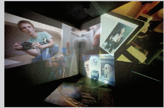
Joan Fontcuberta , Reflectogrammes , 2011, vue d'installation de la mosaïque photographique / installation view photographic mosaic, Sonimagfoto, Barcelone; Derrière le miroir , 2011, deux vues de l'installation vidéo / two views of video installation, Museo de Arte del Banco de la República, Bogotá