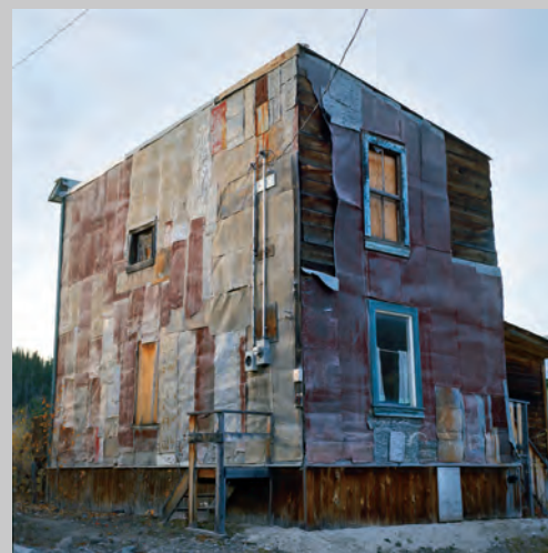
House , de la série The Idea of North , 2008, épreuve chromogénique

Artiste allemande résidant à Vancouver, Birthe Piontek a auparavant élaboré une démarche photographique sur des thématiques liées à l'identité et au lieu, souvent par le biais de portraits équivoques et de mises en scène étranges d'où la figure humaine est absente. De jeunes adultes et des adolescents, portant souvent leur