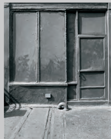
Grey Is A Colour, Gray is a Color (Correctly exposed) , 2012, gelatin silver print, 28 x 36 cm

Bauer has inflected her apparent subject matter with an important detour; we are confronted not with images recording past moments but with windows becoming screens on which appear both reflections and projections of further screens. By "screens" in this case I mean the peculiar, active spatiality of windows and the interplay of these that make up not a fixed image but a perpetually emergent perception, futural rather than historical. The claim that Bauer makes is actually counter-Barthian, the photograph not as "that has been" but