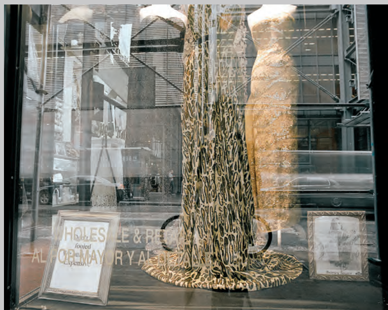
Untitled (Garment District) , 2012, archival inkjet print, 61 x 76 cm

— Stephen Horne is an independent curator and writer living in Montreal and France. He has taught at NSCAD and Concordia Universities and is published in periodicals, catalogues, and anthologies in Canada and elsewhere. —