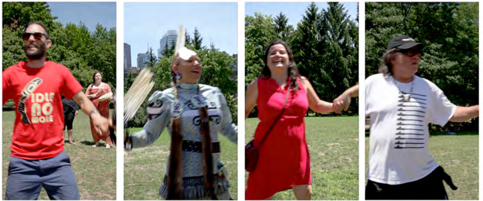
Alan Michelson, RoundDance II , 2013, video installation with sound, courtesy of Ryerson Image Centre

history of colonization and continued racism.” 1