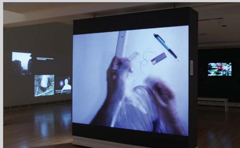
Vue de l'exposition All Is Well, Carleton University Art Gallery, 2015