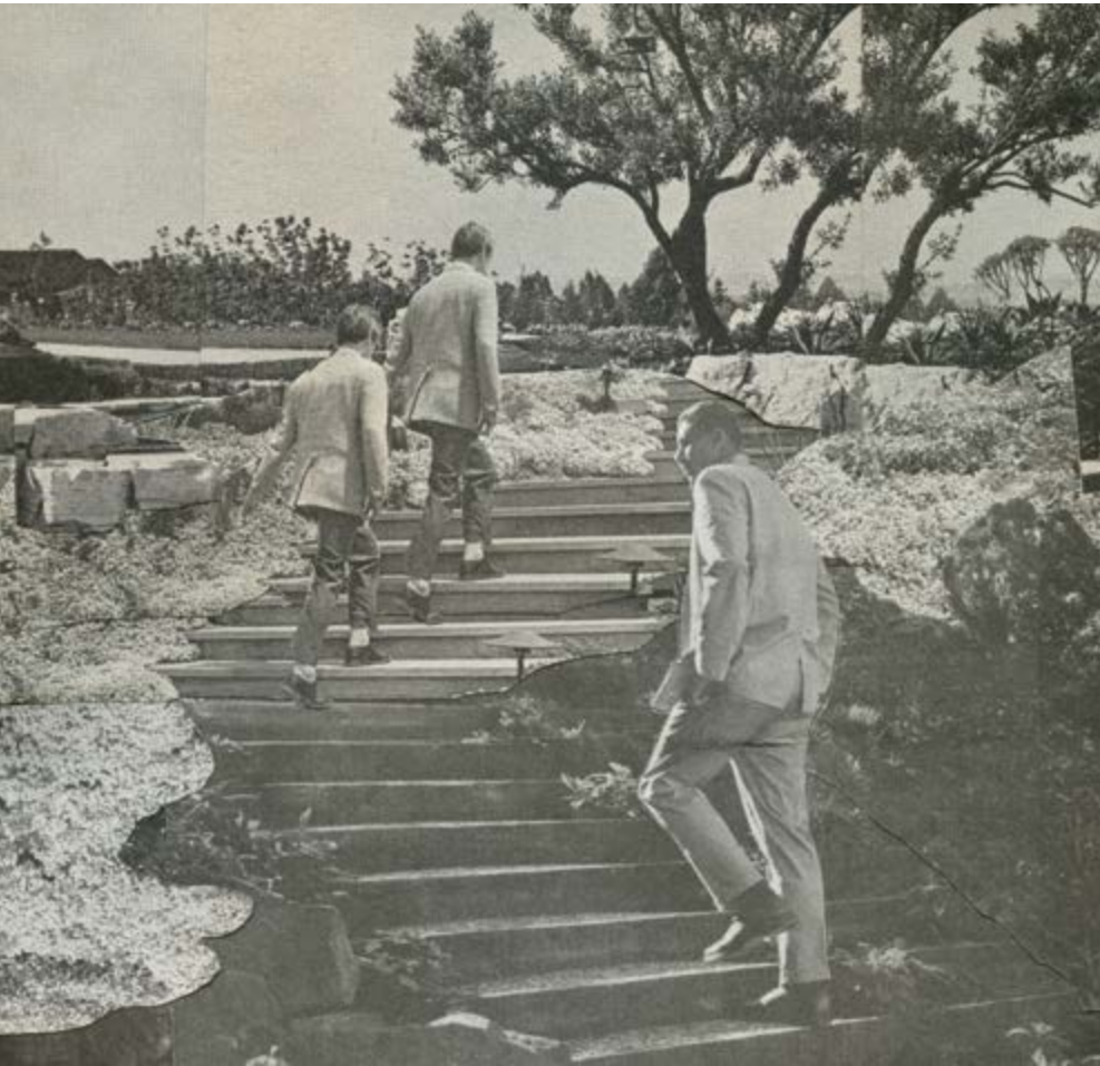
^ Ascending States , 2014, 11 x 11 cm > Creeping Flora , 2013, 11 x 13 cm