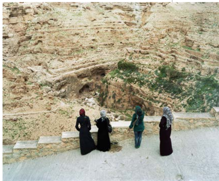
Valérie Jouve, Sans titre , 100 x 130 cm

— — Fabien Pinaroli , commissaire et critique indépendant, collabore avec les revues Frog , 2.0.1 , Zéroquatre , Flux-News . En 2007, il coédite le livre Harald Szeemann. Méthodologie individuelle . En 2012, il propose CoB#2 , un reenactment de l'exposition Celebration of the Body (N.E. Thing Co., 1976) qui donne lieu à deux expositions (à Lyon et à Saint-Fons) et à deux journées d'étude à Londres sur la réactivation d'expositions et de performances. En 2013, il est commissaire de l'exposition Iain Baxter& à Raven Row, Londres. En 2014, en résidence à Schloss Solitude , Stuttgart, il assure la direction éditoriale du livre Re: vers une histoire mineure des performances et des expositions . — —