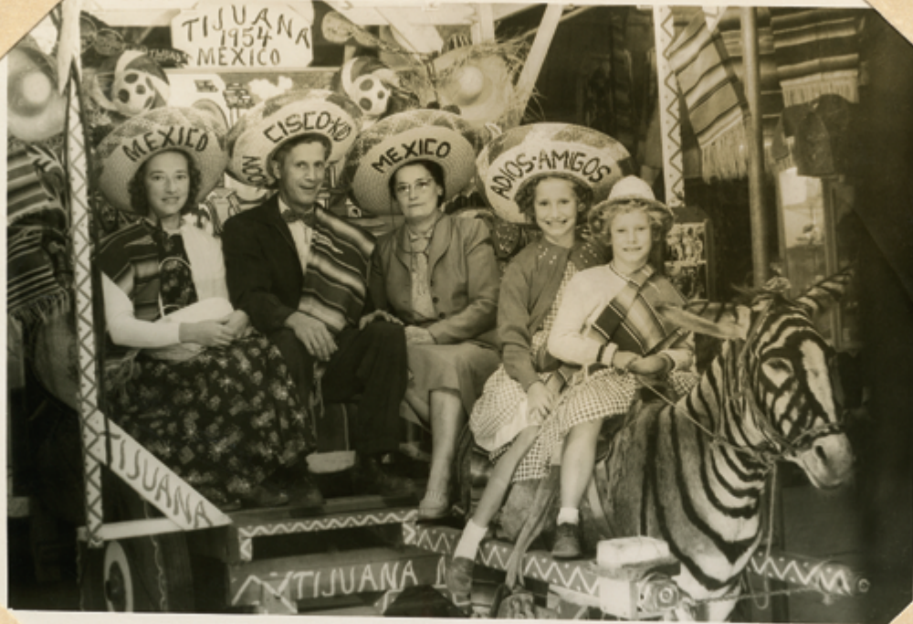
ON FOURTH STREET :: TIJUANA, MEXICO