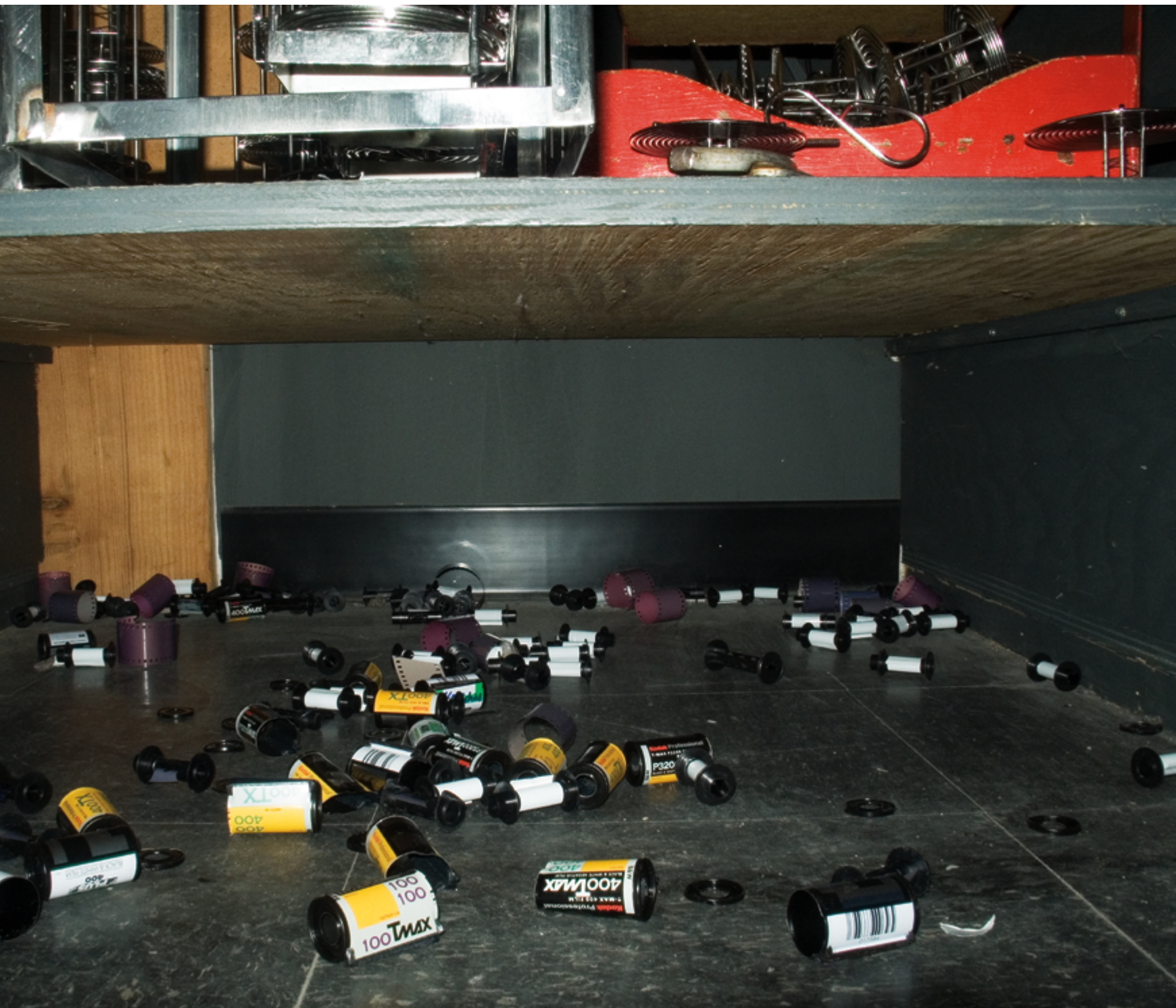
The Donkey that Became a Zebra : histoires de chambre noire