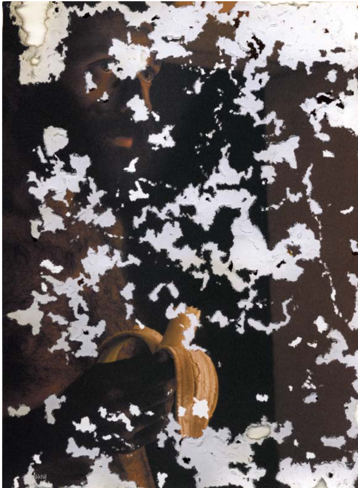
Joan Fontcuberta Trauma