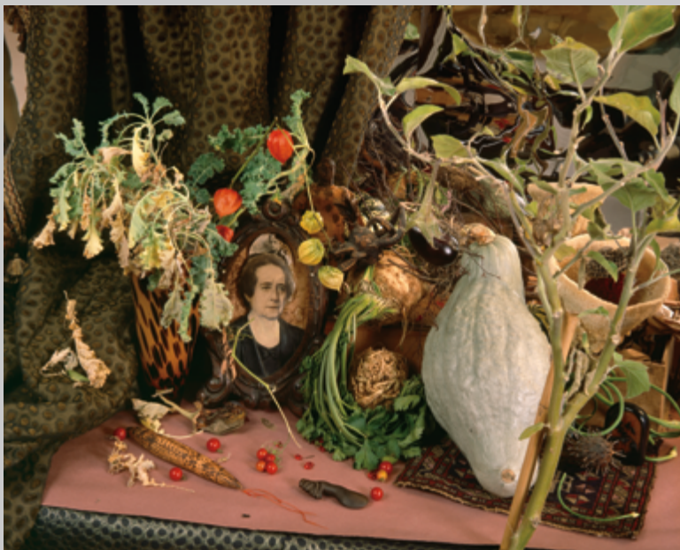
Automnal (diptyque), 2017, 102 × 127 cm ch.

Ces natures mortes, composées de tiges, de feuilles et de fleurs, inanimées et silencieuses, ne sont toutefois pas encore mortes, mais plutôt à tout jamais vivantes, immortalisées par le geste photographique qui marque, temporairement, un arrêt dans le cycle de la vie. Elles habitent un espace dit « surnaturel », pour reprendre l'expression de Barthes 2 ; elles occupent un instant présent qui ne se produit qu'une seule fois et demeurent figées entre le temps de la prise de vue et le temps de la contemplation. Leur vitalité prend forme dans leur simplicité, grâce aux jeux d'opacité et de transparence des vases, des contrastes lumineux, des coloris sombres et vibrants se détachant sur un fond saturé – achromatique. Ce faisant, elles incitent à une réflexion sur les vanités qui, paradoxalement, symbolisent à la fois l'éphémère et