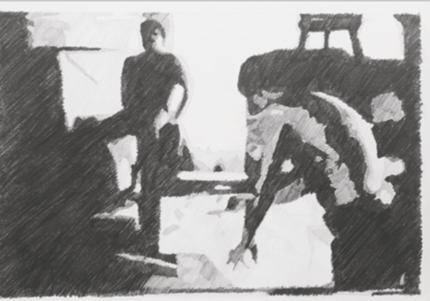
Life Session , 2016, film 16mm, 2 min 30 sec

s'animent, mais l'artiste du film lui-même est dessiné, comme si l'art envahissait tout l'espace. Le frottement du crayon fait alors penser à une caresse, à une excitation, à une pulsion... Ce recouvrement révèle aussi l'existence d'un regard plus vaste, et caché. C'est bien sûr celui du réalisateur, qui filme des jeux de regards sans se faire voir, dans des clairs-obscur à la Caravage. Cette position de voyeur intéresse Henricks, rôle qu'il a lui-même tenu dans sa vidéo Handy Man .