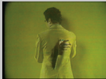
R-G-B, 1974, vidéo couleur, son, 11 min 30 s ; Set of Coincidence, 1974, vidéo couleur, son, 13 min 24 s ; Three Transitions, 1973, vidéo couleur, son, 4 min 53 s

Or, une dimension plus existentielle, que la spatialité radicale des premiers travaux avait jusque-là occultée, va se faire jour. L'importance donnée au visage dès les premières œuvres, conduira insensiblement Peter Campus vers une destination imprévue. Tout commence, semble-t-il, au moment où, en gros plan sur un fond quasi métallique, un acteur aux yeux de braise observe une fixité soutenue, concentré qu'il est sur la pensée de sa finitude ( Head of A Man with Death in His Mind , 1977-1978). Cette cruciale méditation se répercute la même année dans un Polaroid en noir et blanc où une mélancolique physionomie se pétrifie en masque grec ( Untitled Woman's Head en 1978) puis avec Untitled (Man's Head) en 1979.