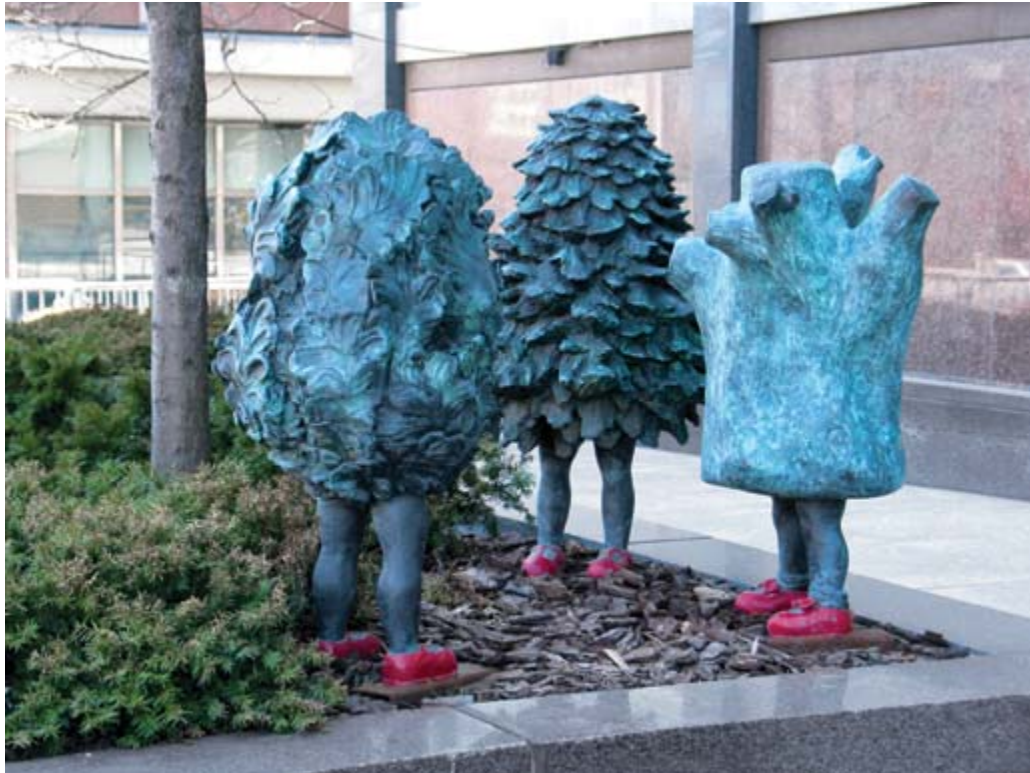
Roxy Paine , One hundred foot line (Ligne de cent pieds) , 2010 acier inoxydable soudé / welded stainless steel, pointe Nepean derrière le Musée des beaux-arts du Canada / Nepean Point, behind the National Gallery of Canada Ottawa, photo 2016