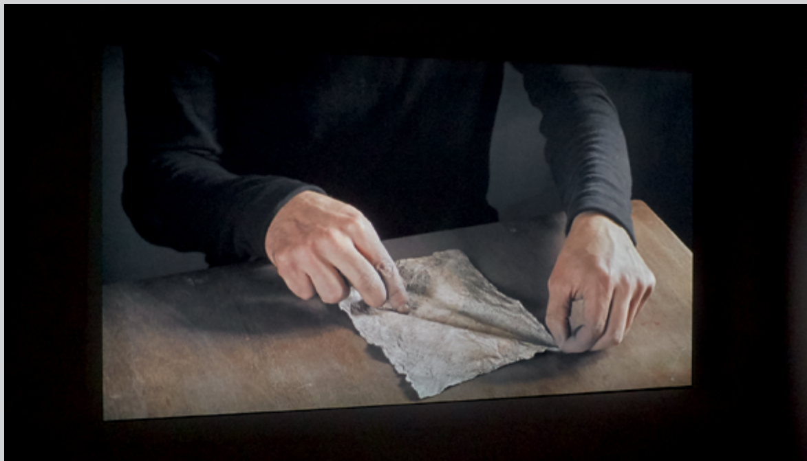
Ligne , 2011, vidéo HD 16/9, couleur, silencieux, 1 min, en boucle, permission des galeries Les Filles du Calvaire, Paris, et Selma Feriani, Londres et Tunis

La pratique d'Ismail Bahri concentre des expériences de seuil. Et la première œuvre de l'exposition en est initiatique. Ligne (2011) présente le très gros plan d'une goutte d'eau sur un poignet à travers laquelle on perçoit les légères pulsations du cœur, autrement imperceptibles. Cette œuvre délicate donne à voir la vie, sa puissance propre, qui tient à sa fragilité, son impermanence. Je pense qu'il n'est pas banal de mentionner que cette vidéo nous capte depuis l'extérieur, par la porte d'entrée qui cadre le centre de l'image. Il y a une sorte d'appel de l'image au dehors, au passage, qui n'est pas autre chose que l'expérience à vivre dès qu'on entre dans l'exposition. Si chez l'artiste la forme est inséparable de sa formation, c'est par la ligne qu'on s'y oriente: « La forme, ce qu'on appelle la forme, ou le résultat, c'est la ligne ou le "patron" qui parcourra ces points en les reliant 4 . »