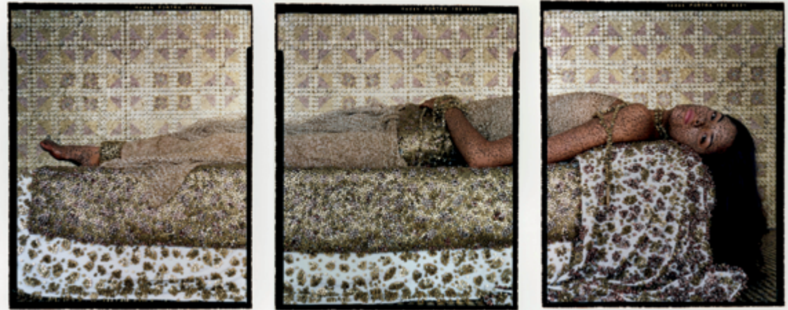
Lalla Essaydi (Marocaine, née en 1956), Bullets Revisited #3 , 2012, triptyque, impression couleur sur aluminium, permission de Miller Yezerki Gallery Boston, Edwynn Houk Gallery, New York, et du Musée des beaux-arts de Boston

symbole de la modernité et du défi au conservatisme des autorités religieuses, et de la féministe pro-islamiste Tahereh Saffarzadeh (1936–2008). Un message saisissant qui a pour effet de soustraire l'image et le réel auquel elle se réfère de toute lecture univoque. Celle qui raconte une histoire en cache en réalité plusieurs. Et nous n'avons pas fini de les écouter.