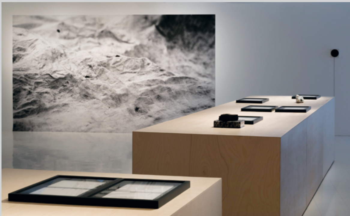
Les falaises se rapprochent, 2018, vue de l'installation et détail