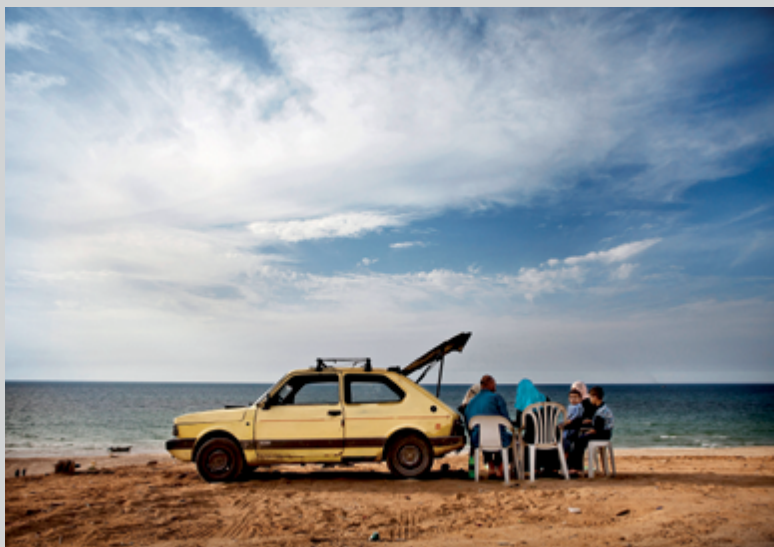
Tanya Habjouqa (Jordanienne, née en 1975), Untitled , de la série The Women of Gaza , 2009, impression à jet d'encre, permission du Musée des beaux-arts de Boston

Postdoctorante et chargée de cours au Département d'histoire de l'art et d'études cinématographiques de l'Université de Montréal, Claudia Polledri assure aussi la coordination scientifique du CRIalt (Centre de recherches intermédiaires sur les arts, les lettres et les techniques, UdeM). Elle est titulaire d'un doctorat en littérature comparée de l'Université de Montréal portant sur les représentations photographiques de Beyrouth (1982–2011) et sur le rapport entre photographie et histoire.