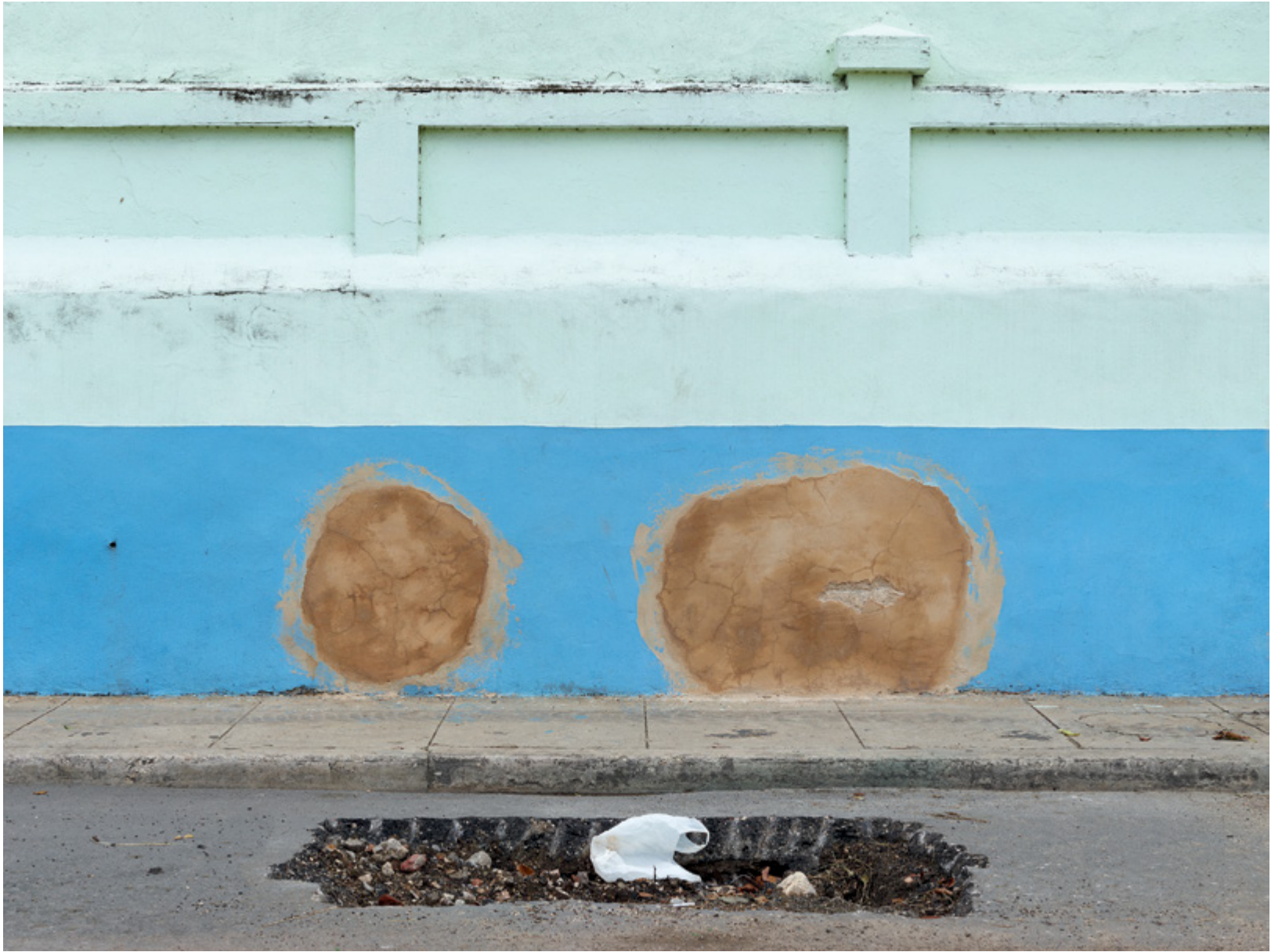
Horizon #170 (Macau), 2014, 110 × 147 cm