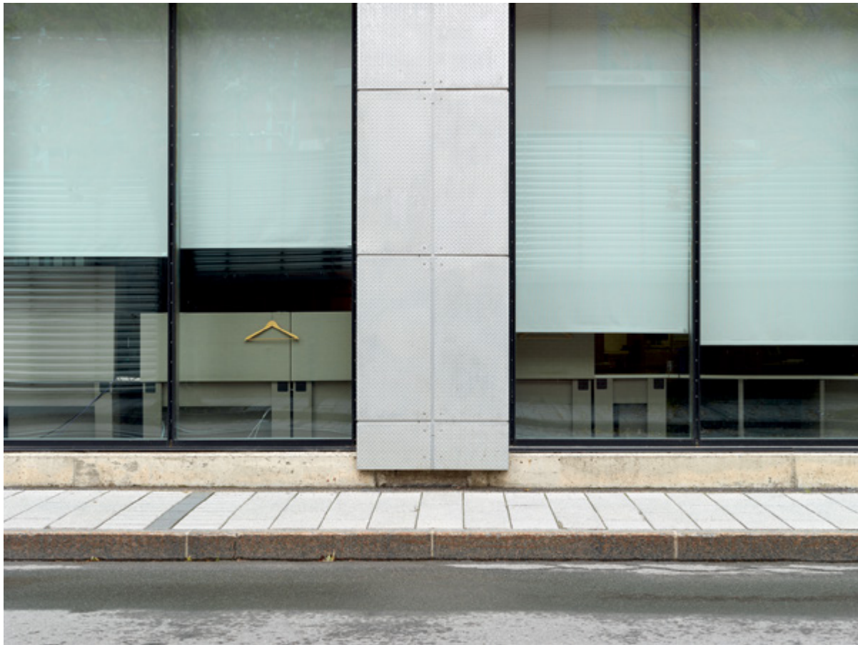
Horizon #052 (Havana), 2017, 110 × 147 cm True Nature #031 (Montreal), 2018, 20 × 27 cm