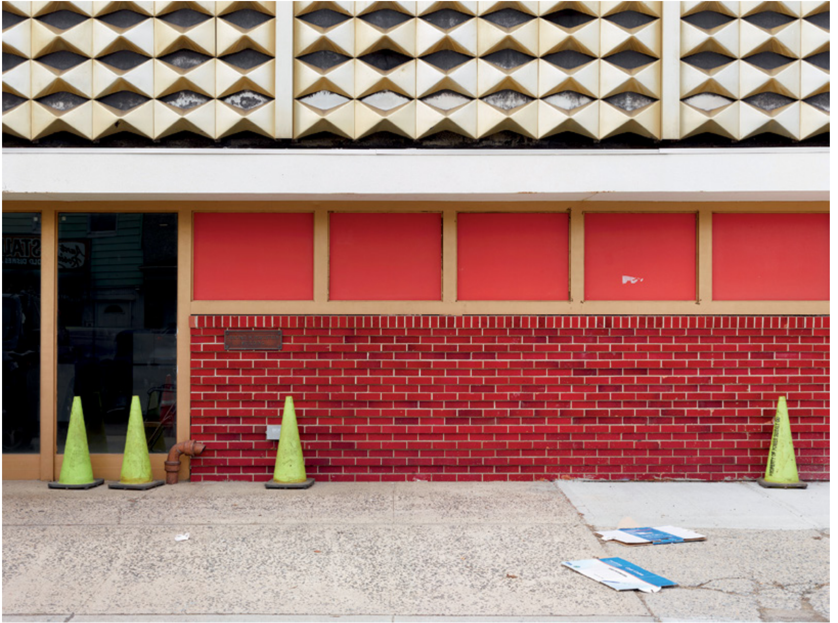
True Nature #003 (Hanoi), 2016, 20 × 27 cm True Nature #020 (New York), 2017, 20 × 27 cm

TOUTES LES PHOTOS / ALL PHOTOS Archival pigment prints on fine art paper / épreuves pigments d'archives sur papier fine art