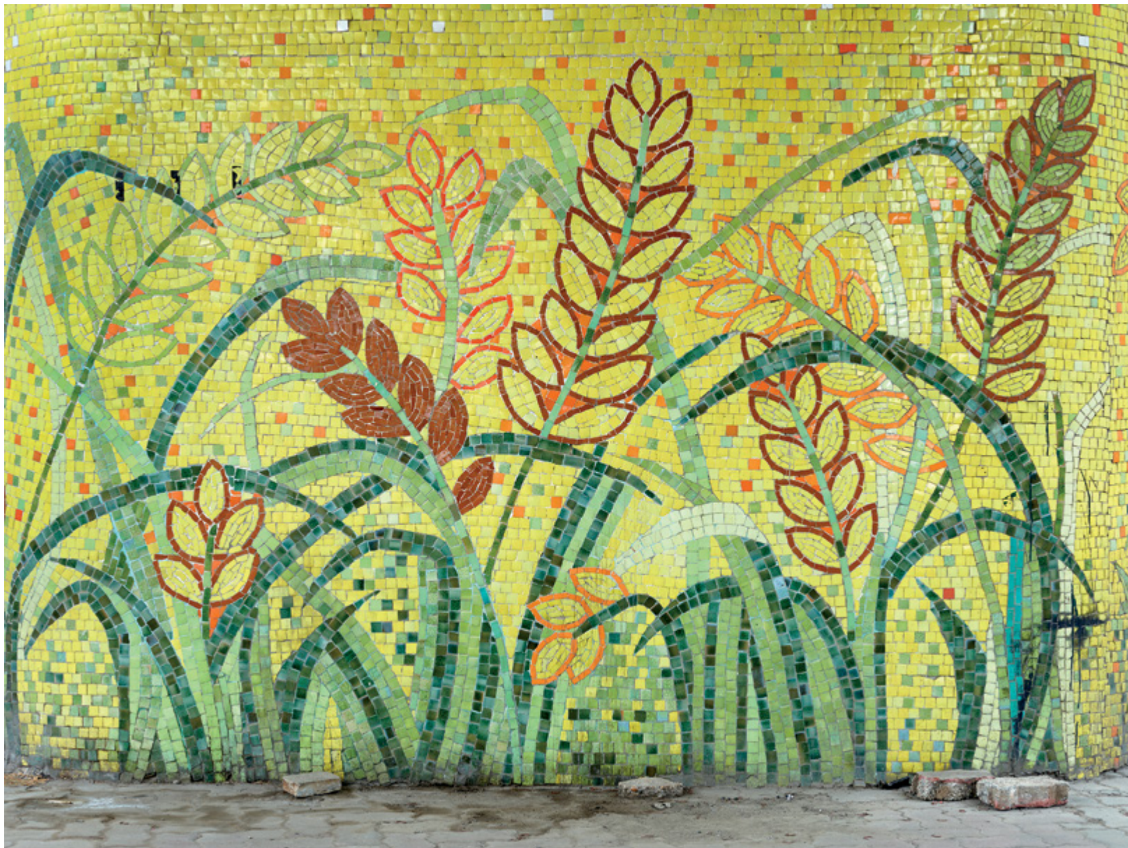
Horizon #01 (Hanoi), 2016, 110 × 147 cm