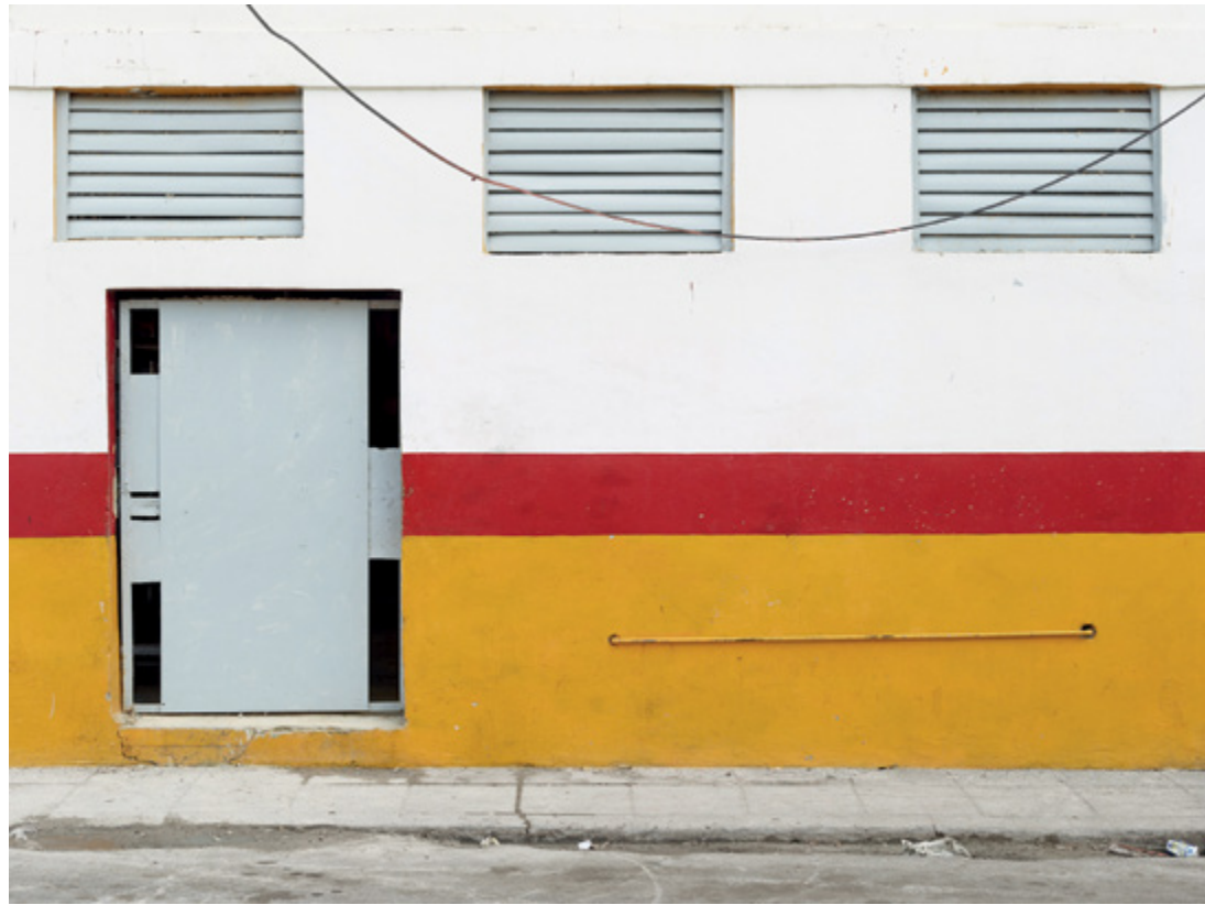
True Nature #054-069 (Havana), 2017 60 x 80 cm ea./ch.