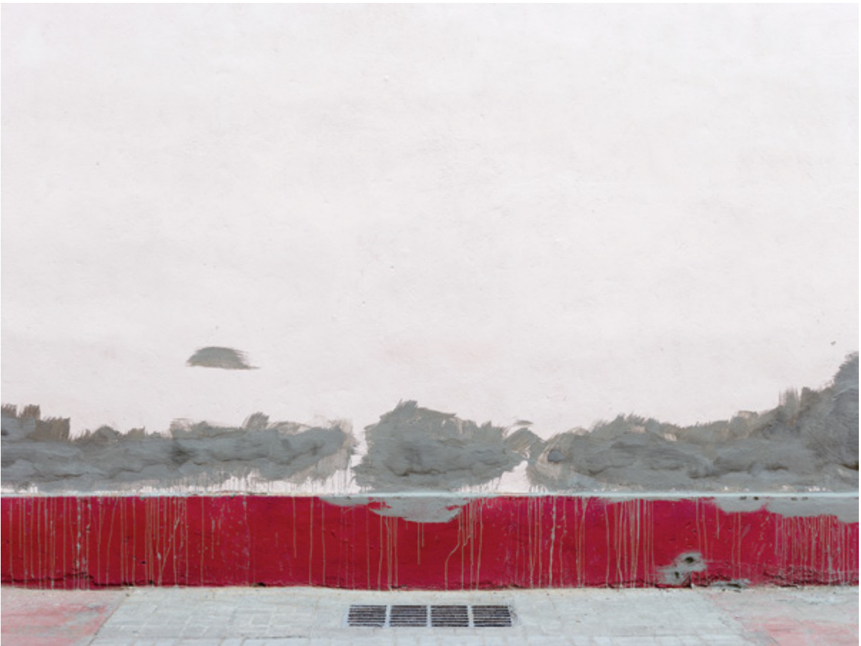
Horizon #047 (Havana), 2017, 110 × 147 cm True Nature #063 (Santiago), 2017, 110 × 147 cm