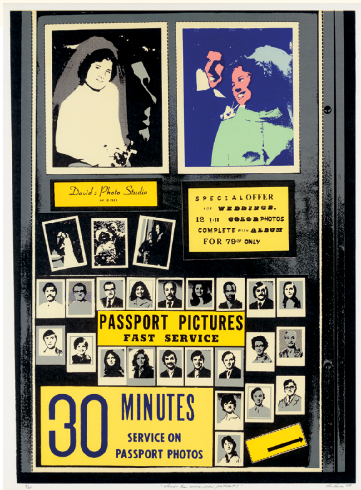
Michel Leclair, Veux-tu avoir mon portrait? , 1974, photo-sérigraphie / photo silkscreen, 62 x 77 cm, collection d'œuvres d'art de l'Université de Montréal

les images les unes par rapport aux autres pour former un ensemble ouvert à la lecture au fil du regard du spectateur. Dans son questionnement sur l'identité, Suzy Lake déploie, en une grille composée de 90 images, la lente transformation de son visage peint en blanc sur lequel elle trace une nouvelle physiognomie. Sa performance est mise en scène pour et par l'appareil photo qui, d'un point de vue fixe, enregistre non seulement des traces destinées à pérenniser le geste de l'artiste, mais le processus que met à jour la continuité des événements. Dans la recomposition par