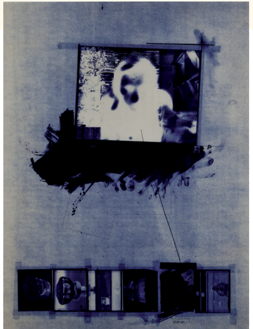
Charles Gagnon, Millerton , 1971, épreuve Ozalid / blueprint, collection du Musée des beaux-arts du Québec