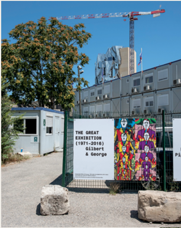
Site de la Fondation Luma, avec le nouveau bâtiment de Frank Gehry en construction / Site of Luma Foundation with Frank Gehry's building under construction