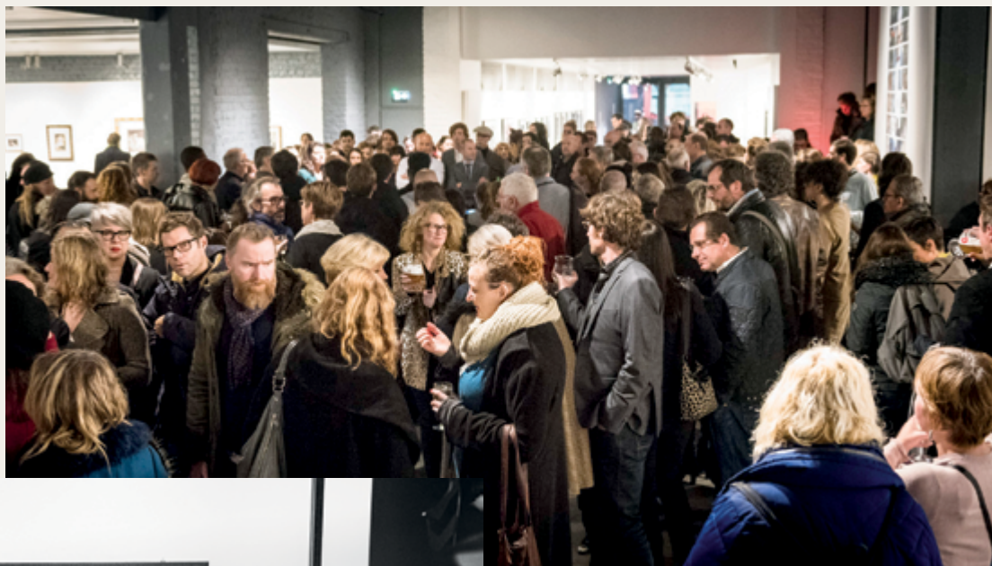
Maison de la photographie, à Lille, un vernissage et une vue de l'exposition Costa Gavras / an opening and a view of Costa Gavras exhibition