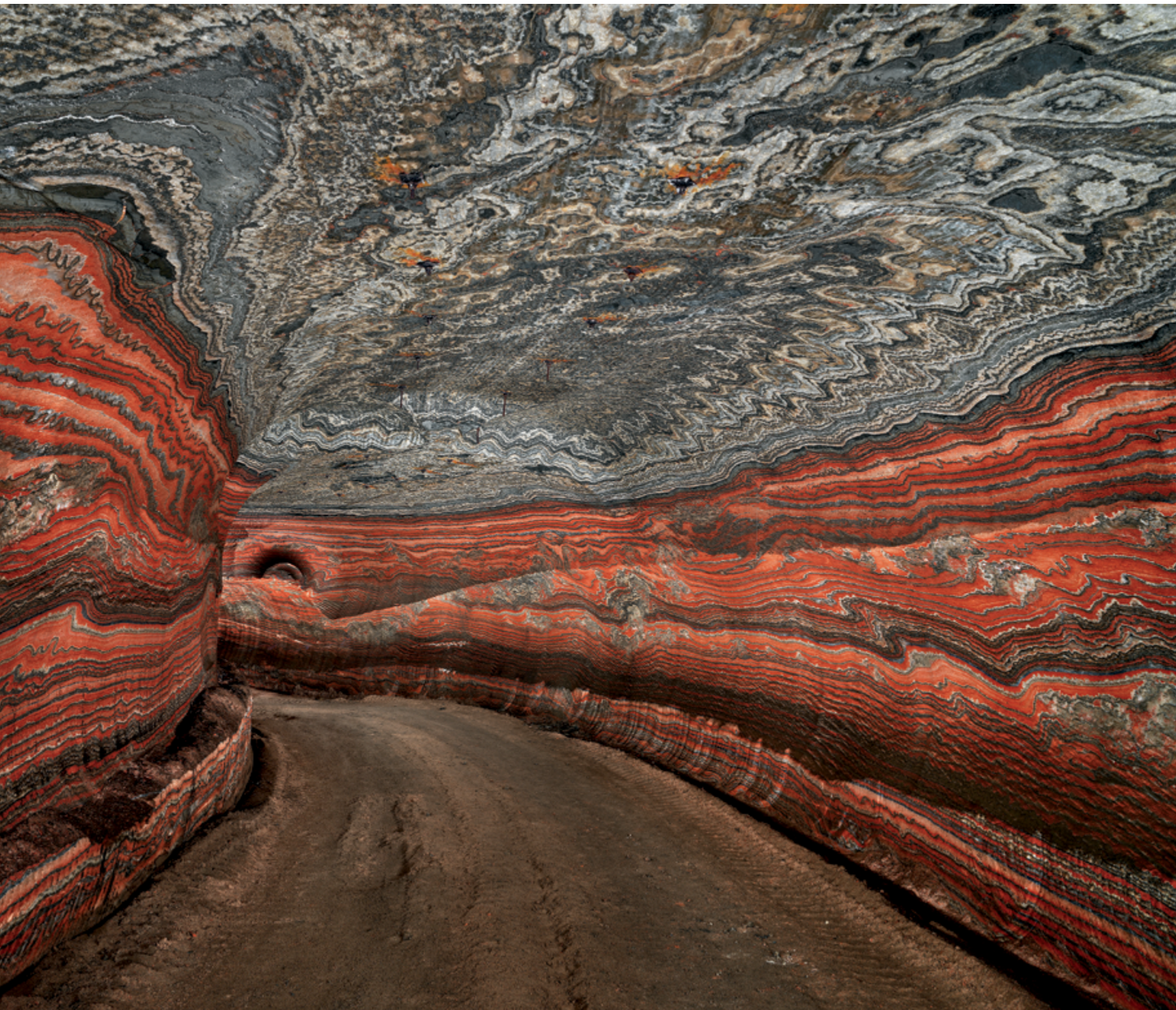
Uralkali Potash Mine #2, Berezniki, Russia, 2017