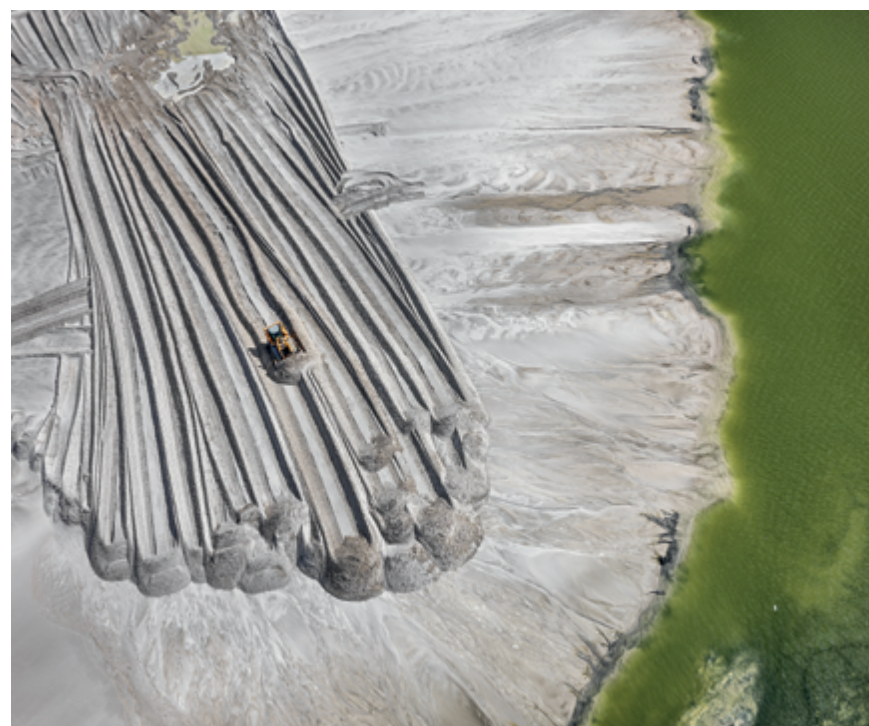
Phosphor Tailings Pond #4, Near Lakeland, Florida, USA, 2012