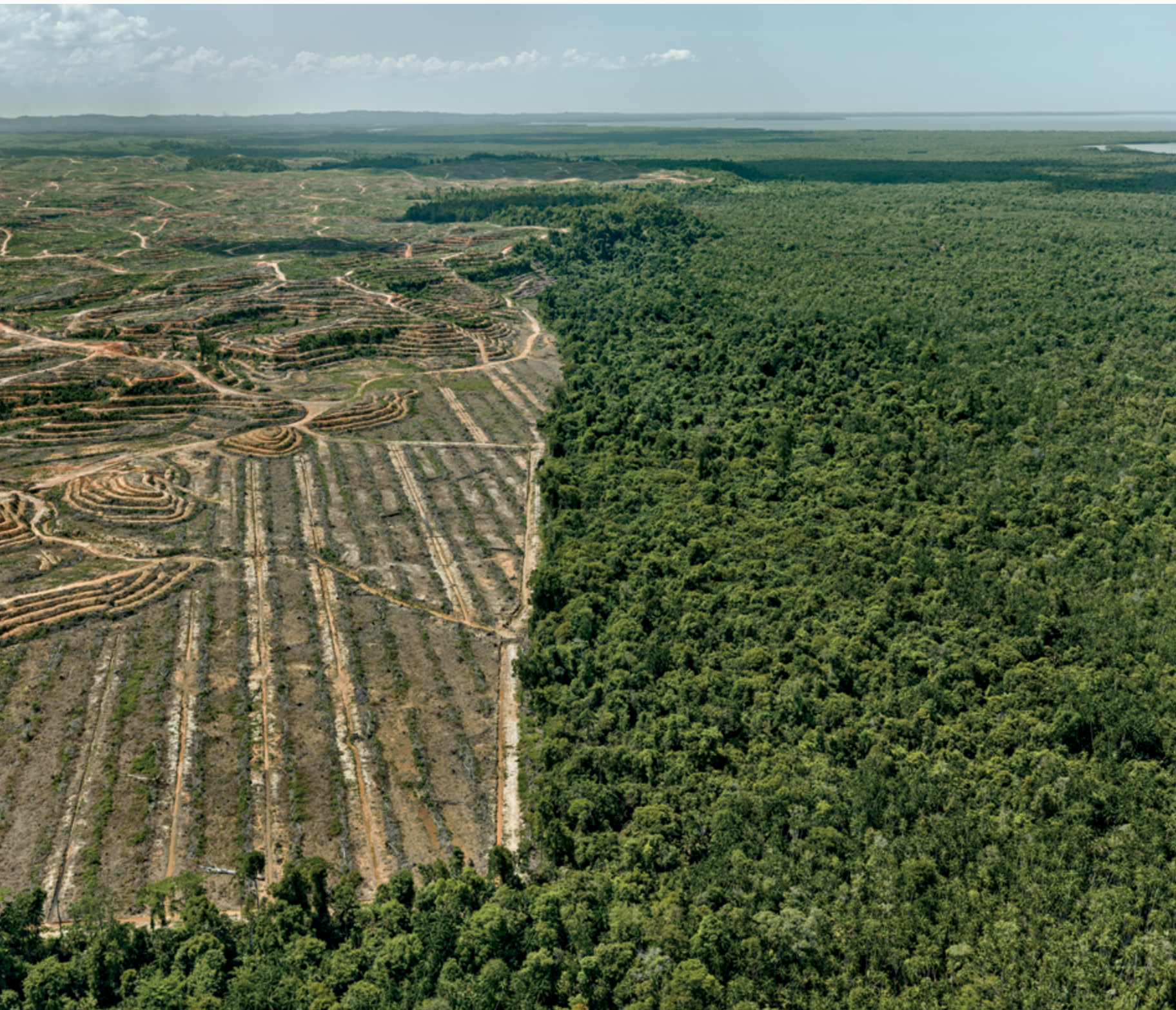
Clearcut #1, Palm Oil Plantation, Borneo, Malaysia, 2016

désarme tout. La proximité physique censée être transmise par le processus retombe à plat et le passage entre la « réalité photographique » et celle du virtuel n'opère pas. C'est un leurre, un piège qui désamorce la technophilie d'Edward Burtynsky et sa vision idéalisée de l'enfer environnemental. La technologie ne peut rien ici pour délivrer les images de leur impotence.