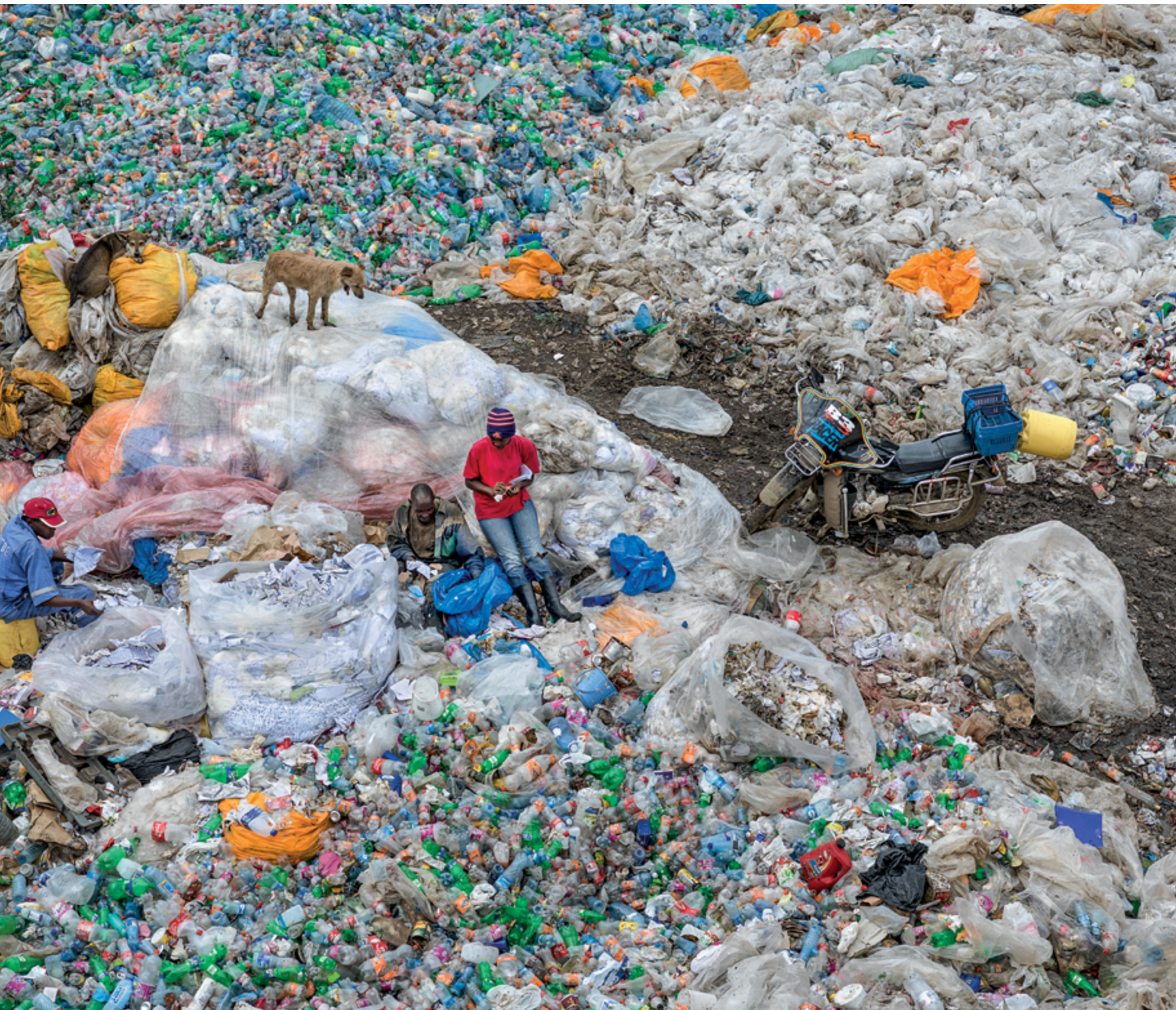
Dandora Landfill #3, Plastics Recycling, Nairobi, Kenya, 2016

l'exposition, celle-ci s'avère redondante, une sorte de mise en pause sur certaines scènes, exagérément agrandies jusqu'à sept mètres de largeur pour les plus massives. Défilent paysages urbains de la tentaculaire Lagos, carrière de marbre à Carrare, coupes claires à Bornéo, forêt pluviale et de trop nombreuses projections extraites du film lui-même.