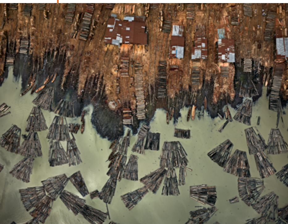
Saw Mills #1, Lagos, Nigeria, 2016