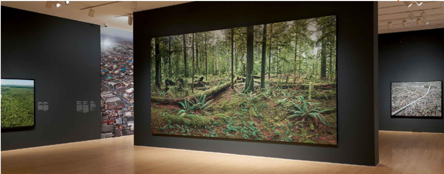
Vue de l'exposition / exhibition view, Musée des beaux-arts du Canada / National Gallery of Canada