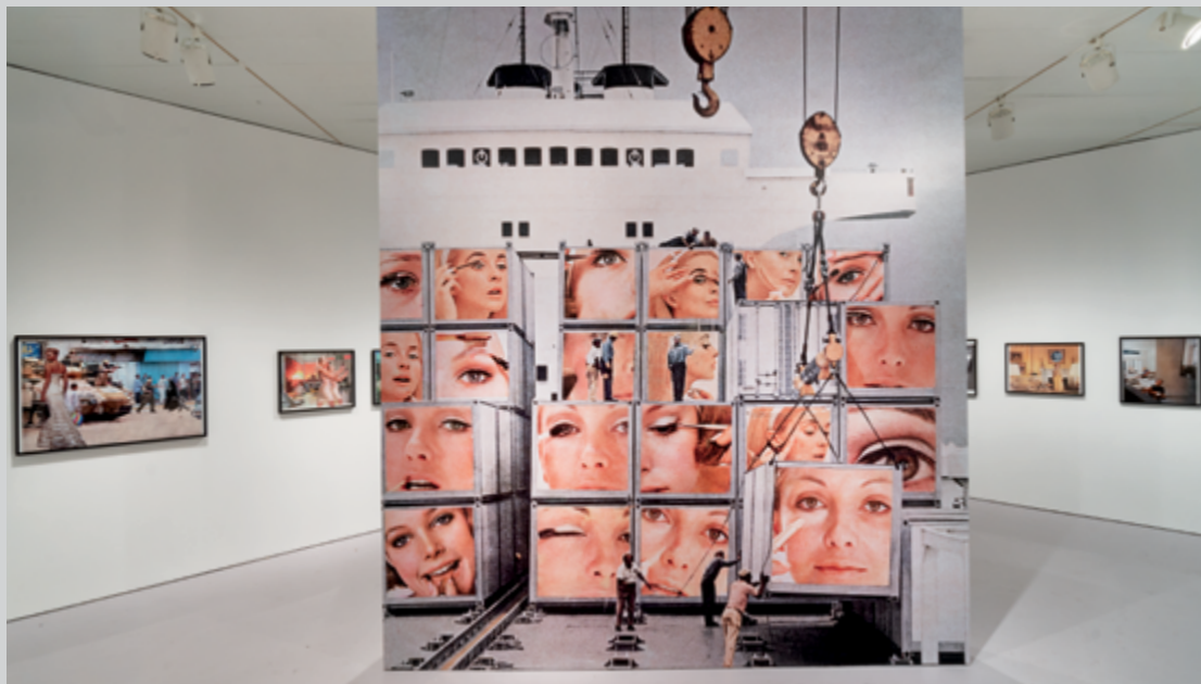
Martha Rosler: Irrespective, vue de l'exposition au Jewish Museum de New York

Rosler a également superposé la liste d'une centaine de personnes faisant partie de minorités visibles tuées par des policiers dans la rue ou pendant leur détention provisoire. C'est donc sur une ultime dénonciation des inégalités sociales que le parcours de cette exposition poignante, provocante, et dont toutes les œuvres demeurent d'actualité, se terminait. Un appel, donc, à la prise de parole et à un continu engagement politique et social, ainsi qu'à la nécessité de la circulation des œuvres de Martha Rosler dans les différentes sphères de la vie.