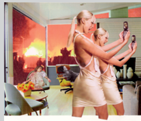
Cleaning the Drapes , de la série House Beautiful: Bringing the War Home , 1967-1972 ; Photo-Op , de la série House Beautiful: Bringing the War Home , New Series , 2004, photomontages, permission de l'artiste et de Mitchell-Innes & Nash, New York