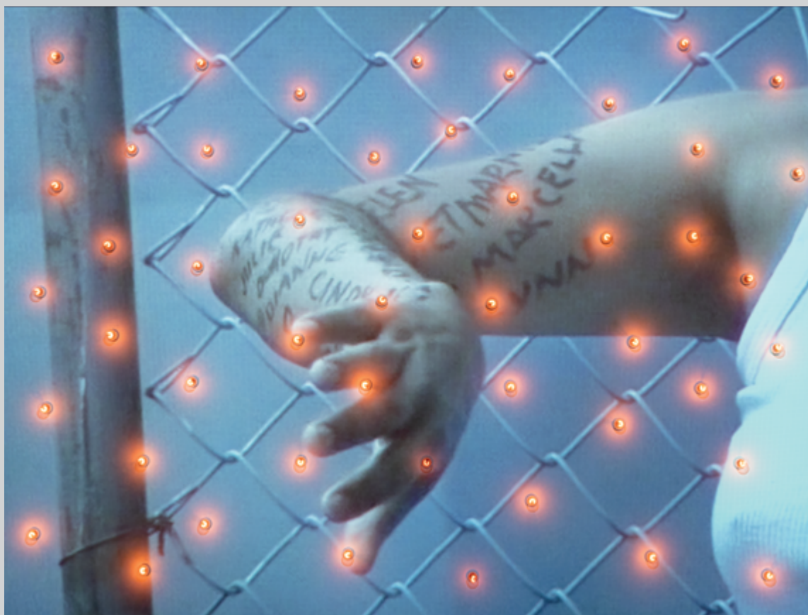
The Named and Unnamed , 2002, projection vidéo et ampoules, 240 × 316 × 32 cm, collection du Musée des beaux-arts du Canada