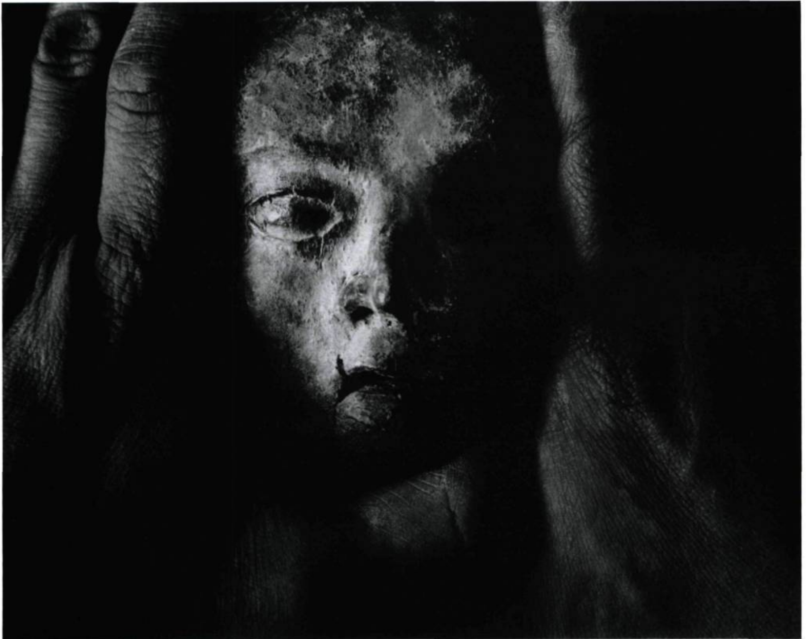
Desde la tierra del día y la noche, 1986