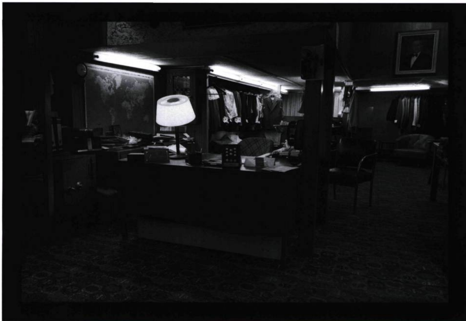
Sans titre n° 9 (Les Lieux Maitres), 1995