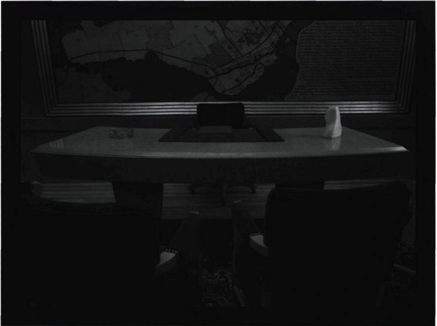
Sans titre n° 8 (Les Lieux Maitres), 1994