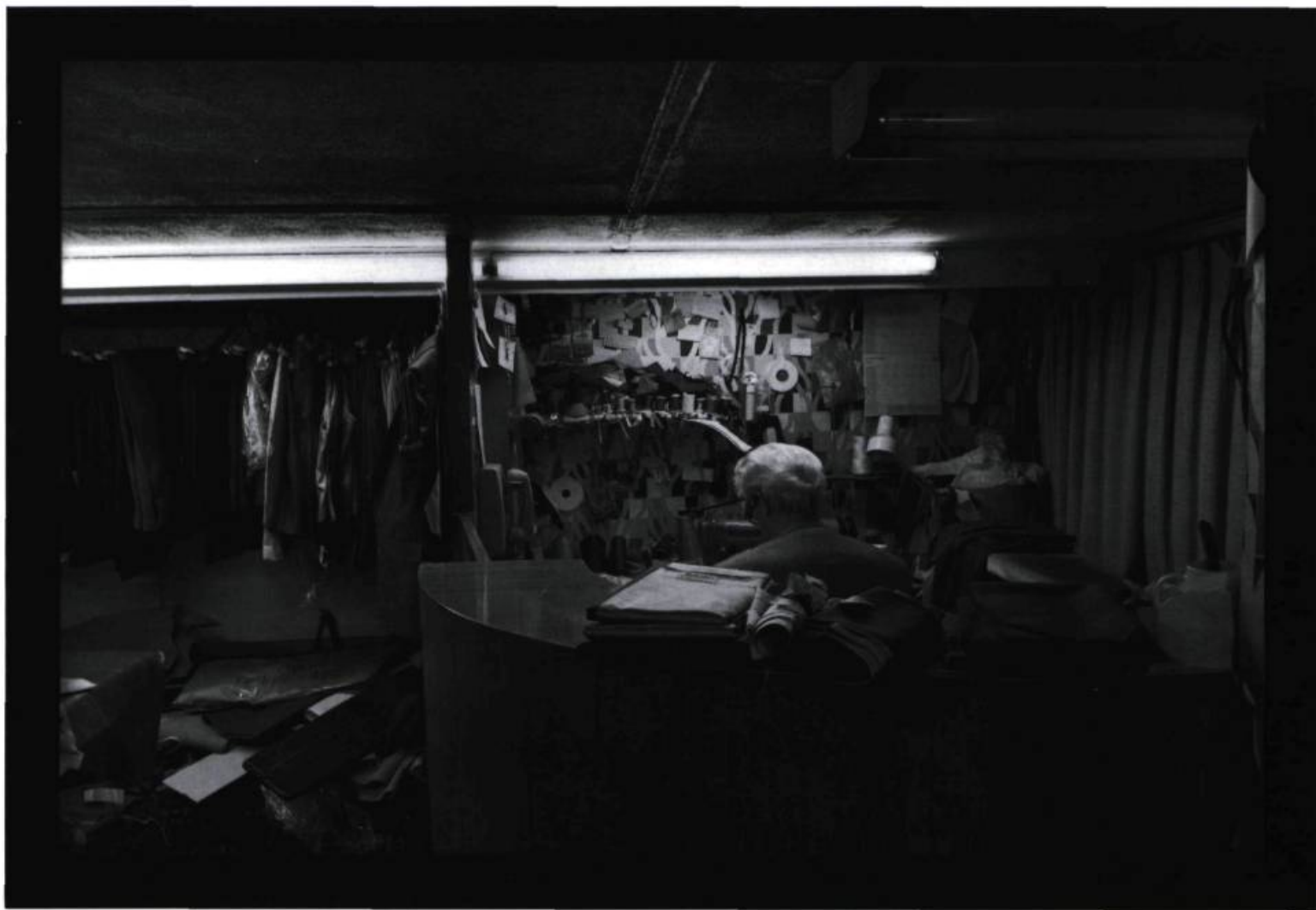
Sans titre n° 10 (Les Lieux Maîtres), 1995