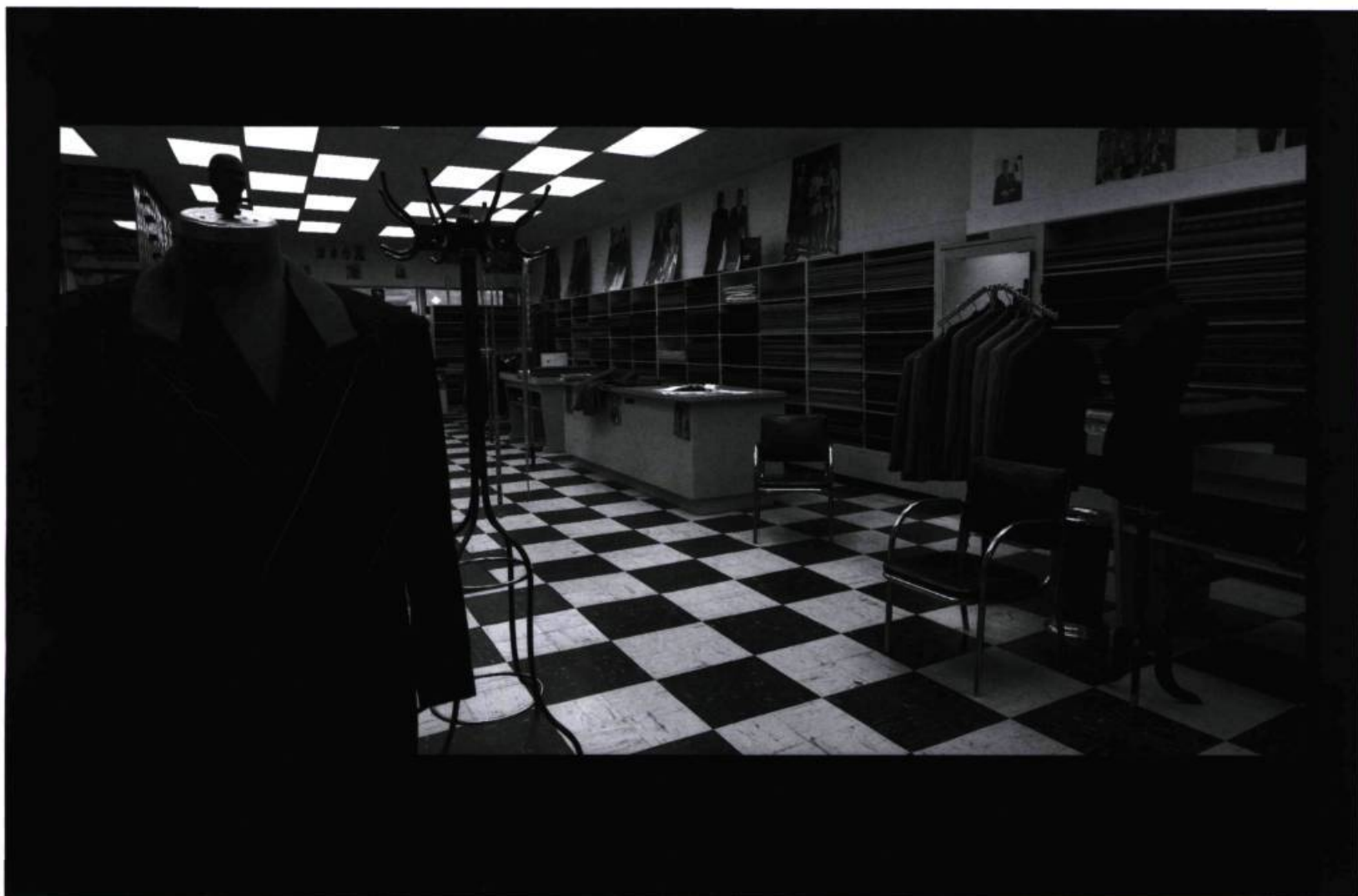
Sans titre n° 11 (Les Lieux Maîtres), 1995