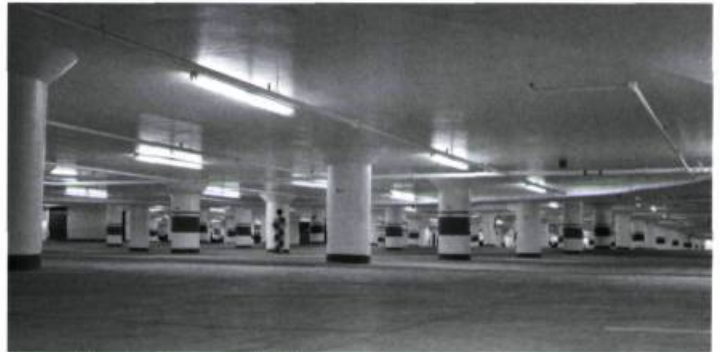
Paysage étalonné, stationnement intérieur, Toronto, Ontario, 1998, 110 X 165 cm, épreuve couleur.