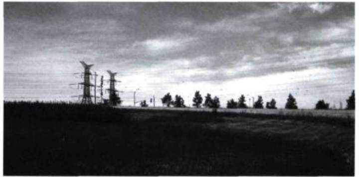
Paysage étalonné, bretelle d'autoroute, près de Toronto, Ontario, 1997, 110 X 165 cm, épreuve couleur.