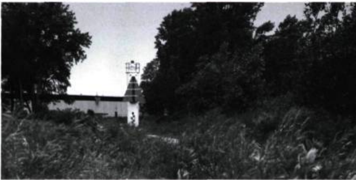
Paysage étalonné, signalisation maritime, lac Ontario, Toronto, 1997, 110 X 165 cm, épreuve couleur.