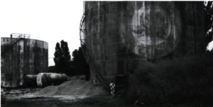
Paysage étalonné, site et citernes d'huile désaffectés, Toronto, Ontario, 1997, 110 X 165 cm, épreuve couleur.

Les photographies en couleur de Denis Farley dans le numéro 46 de CVphoto aurait du apparaître avec leur titre. Nous nous en excusons auprès de l'artiste.