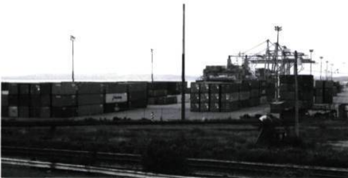
Paysage étalonné, containers dans le port d'Halifax, Nouvelle Écosse, 1997, 110 X 165 cm, épreuve couleur.