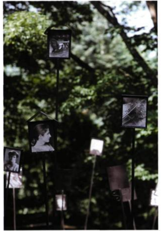
Sans titre 80 photographies sur tiges métalliques 2.5 m de hauteur Installation in situ , Maison Hamel-Bruneau, Québec 1996