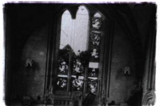
Sans titre 3 photographies et fragments d'architecture photos : 1,2 x 1,7 m Résidence, Centre d'art contemporain de Basse-Normandie Hérouville Saint-Clair 1998