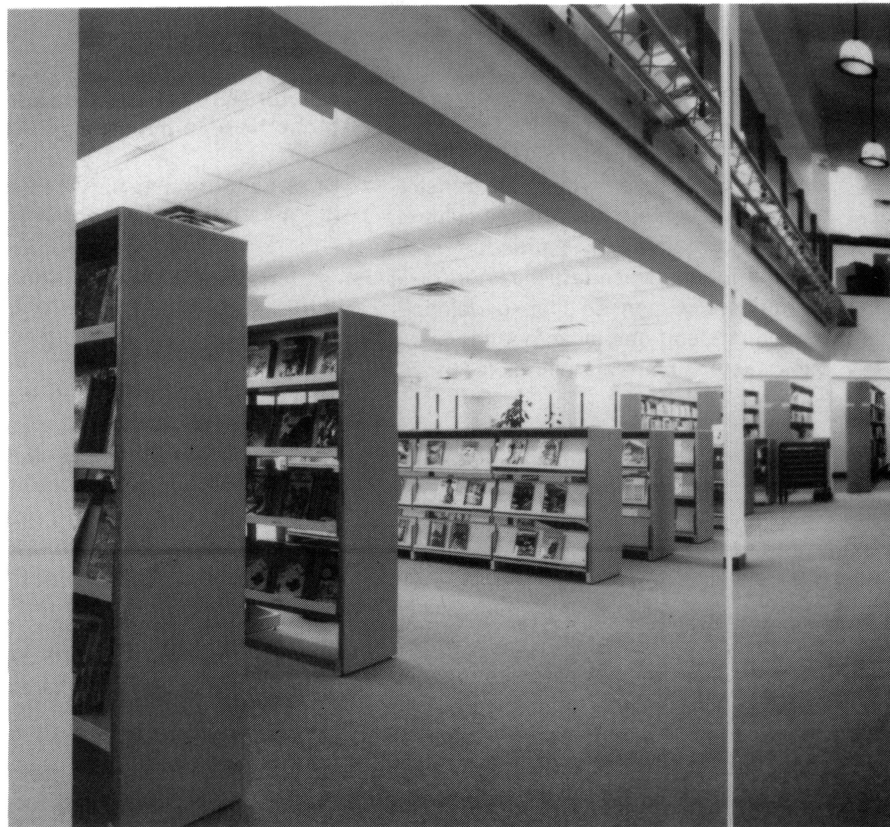
Bibliothèque publique de Rouyn-Noranda