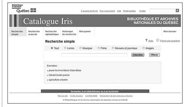
Figure 2 Recherche simple — Catalogue Iris de BANQ

pour l'élaboration, la structure et la présentation des index inclut deux sections sur la présentation des index. La section 8 s'intitule « Classement des entrées à l'intérieur de l'index » et la section 9 a pour titre « Présentation des index imprimés » (Organisation internationale de normalisation 1996, 29-32 ; 33-37).