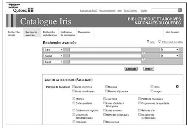
Figure 3 Recherche avancée — Catalogue Iris de BANQ

presque 70 ans et qui contient trois objets assez insolites : deux éventails et une baguette de direction ! Du côté des bibliothèques, nous constatons également une grande diversité de types de documents à BANQ et ce, dès la recherche simple dans le catalogue Iris (Figure 2), tels que livres, films, musique, etc. Mais la recherche avancée offre 20 types de documents (Figure 3) tels que livres sonores, cartes postales, programmes de spectacle, etc.