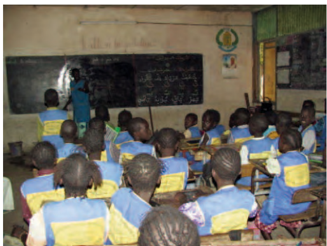
Classe d'une école PFIE, Sénégal

Interrogés sur les effets positifs du programme, les intervenants du PFIE ont été nombreux à faire état des acquis comportementaux des élèves. Les élèves auraient développé une conscience et des « réflexes » en matière environnementale, en particulier en ce qui a trait à la préservation et à l'assainissement de l'environnement de leur classe et de leur école. Les mauvaises habitudes antérieures, consistant à salir, à endommager ou à gaspiller les ressources, auraient fait place à une attitude de respect et à un engagement dans des actions visant l'entretien et l'amélioration de l'environnement scolaire.