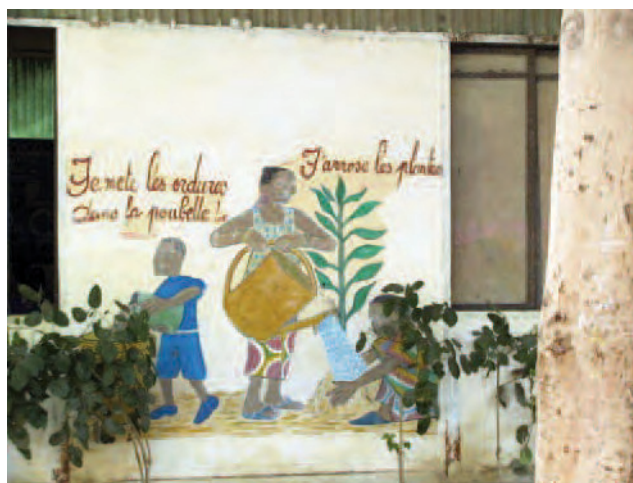
Cour d'une école PFIE, Sénégal

De nombreux exemples sont donnés, qui ont principalement trait à la préservation de l'environnement : « Avant le démarrage de l'éducation environnementale, les enfants jetaient de manière spontanée les papiers, comme ça, dans la cour. Ils écrivaient sur les murs, ils écrivaient sur les tables » (E11-10.3). Ils « cassaient les arbres » (E3-1.12). Maintenant, grâce au PFIE, les élèves ont développé l'amour des arbres et l'amour d'un environnement propre (E6-3.2), ils « ne cassent plus les arbres » (E3-1.18), « ils ne touchent plus aux manguiers » (E11-10.3), le « réflexe de l'utilisation des poubelles [est installé], la netteté aussi des toilettes » (E14 1.32), « les réflexes de ramasser les ordures » (E3-8.17), « ils ramassent les papiers, ils mettent ça dans les poubelles » (E3-1.18), « ils ne laissent pas de saleté dans la cour » (E3-2.21). Ils ont développé « de bonnes habitudes avec le PFIE, par exemple, ne plus gaspiller l'eau en arrosant » (E3-8.17). « Il y a une différence, quoi, entre les élèves PFIE et les non-PFIE » (E3-8.22).