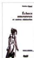
ÉCHECS AMOUREUX ET AUTRES NIAISERIES Stanké, 2004