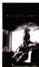
ÇA SENT LA COUPE Stanké, 2004