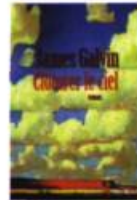
CLÔTURER LE CIEL James Galvin 2004