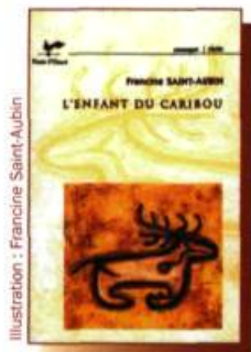
Francine SAINT-AUBIN L'enfant du Caribou 192 p. - 22,95 $

Découvrez les nouveautés des Éditions Vents d'Ouest