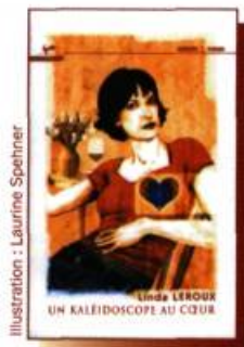
Linda LEROUX Un kaléidoscope au cœur 184 p. - 19,95 $